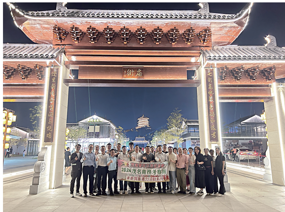
参观潘茂名公园庙街夜市。