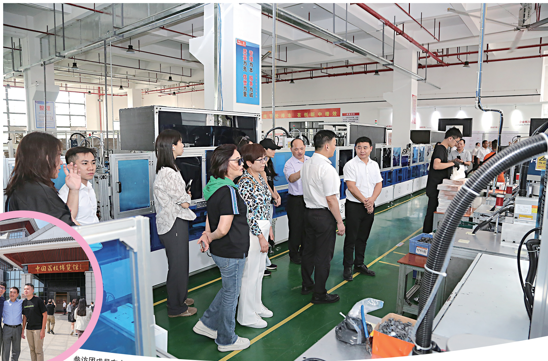
在高州市佛茂产业转移合作园蒲康片区参观。

10月22日至24日,为落实市委市政府“融珠入湾”行动,大湾区及台湾青年企业家一行23人来茂名开展经贸考察交流活动,深入感受茂名产业发展、乡村振兴等高质量发展成果,增进大湾区及台湾青年企业家对茂名投资环境和发展机遇的了解,并围绕加快培育新质生产力进行座谈交流,促进与茂名优质资源的对接与合作,共谋发展新篇章。