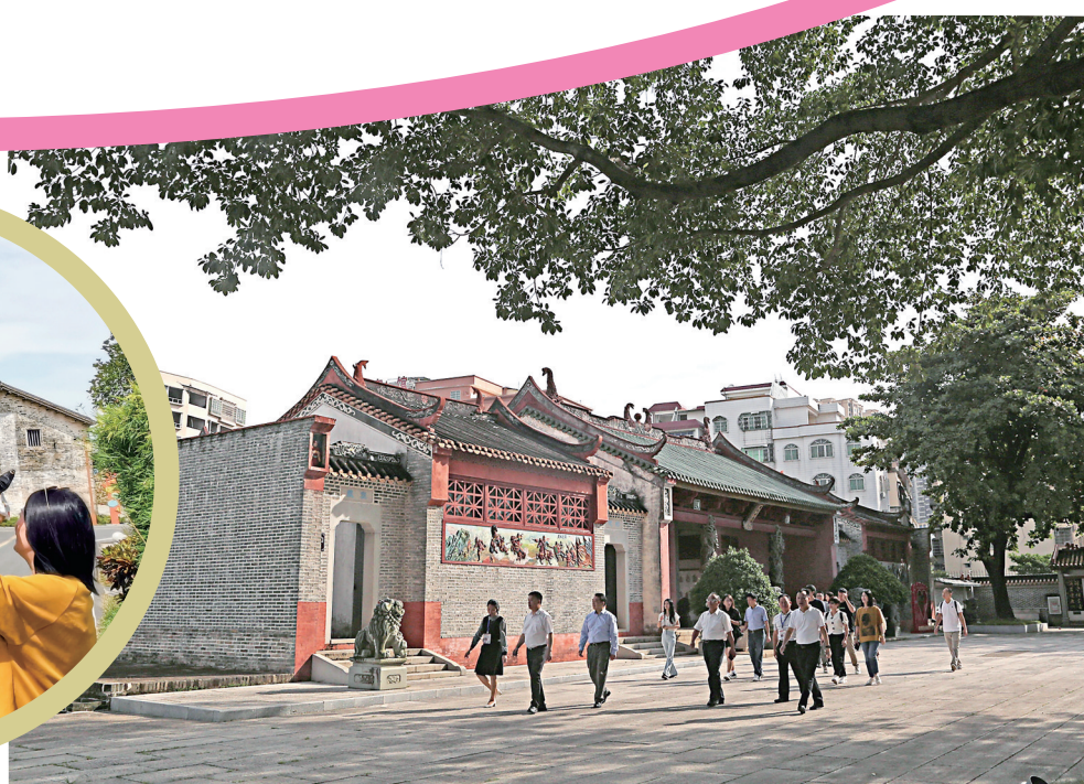
参观团参观高州冼太庙,了解冼夫人生平事迹。