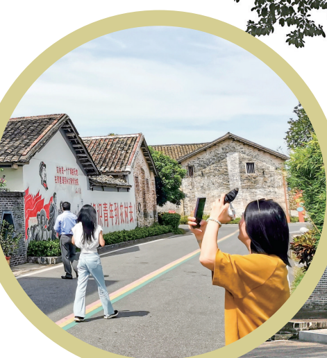
在高州市分界镇杏花村参观。