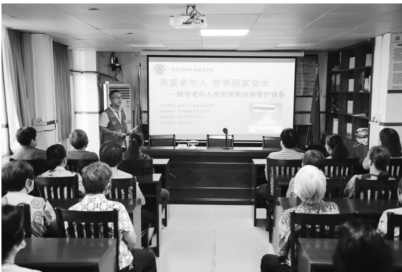
讲座现场。

入基层开展技术经济指标分析,查找影响公司能耗、辅材等关键成本指标提升原因,制定提升措施,狠抓日优化、周督办、月考核,实现指标提升。深化合同谈判,优化工作量,精细管理严控非生产性支出降本,同比降低10%。发动全员节约,养成勤俭创效的良好习惯。10月以来,炼油电气车间坚持做好预防性维护工作,组织骨干力量自主开展UPS、直流屏蓄电池放电试验工作,共自主完成了15组蓄电池放电试验工作,节省费用约4.5万元。(龙泰良 张亚培 张博)