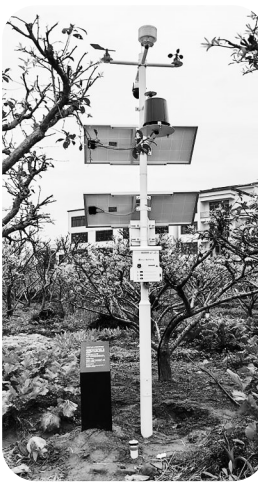
▲气象站、土壤墒情站。