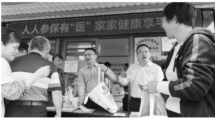
工作人员向群众发放医保宣传资料,讲解医保相关政策。