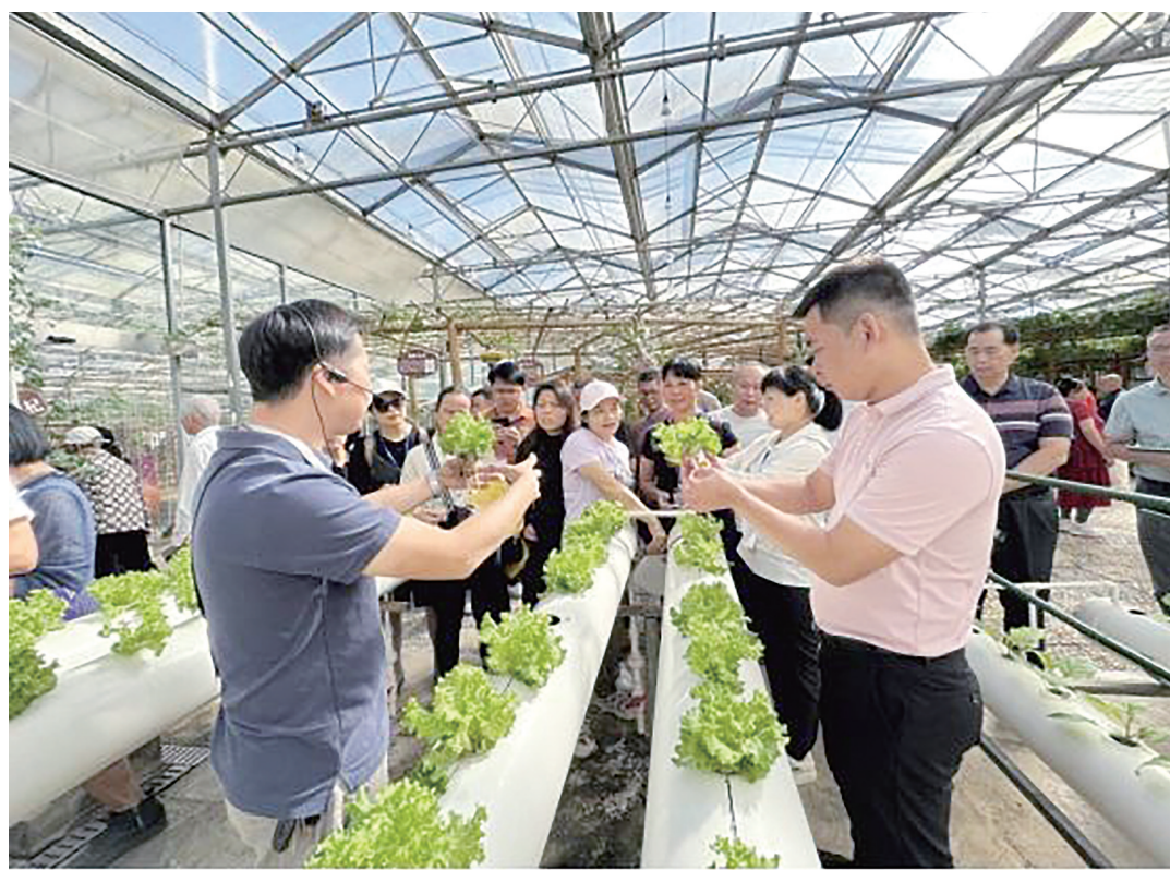
图为学员观摩南宁市八桂田园。该园集现代农业设施展示、农业新品种新技术新成果应用推广、农业产业化经营、科普教育基地、农业职业教育实训基地、农业观光旅游等六大功能于一体。

一直以来,茂南区都十分重视农技员培训工作,并落实相关行动,整合国家、省、市培训项目,依托农技推广信息平台和外出现场教学等方式对农技员进行培训。该区现有农技员176人,每年组织全区农技员集中培训一次以上,帮助农技员“充电蓄能”,截至目前,累计培训农技员1000多人次。通过培训,学员们了解到先进的农业种植技术和管理理念,围绕绿色农业发展、提升农业