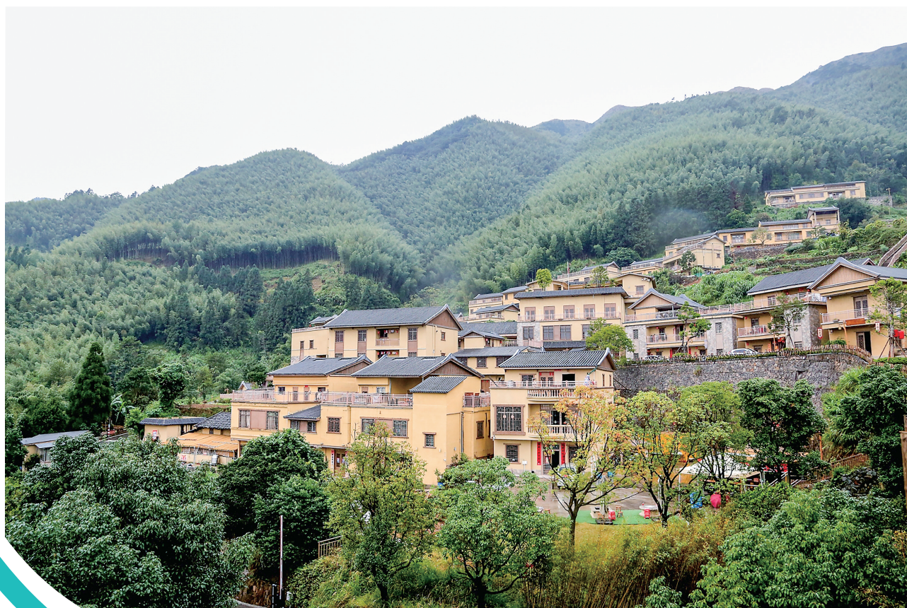
满眼翠绿的马安村。

观云海、探竹林、叹氧吧、穿古装、赏灯色、吃竹筒饭、饮竹筒酒、游露天泳……多姿多彩的文旅项目令游客流连忘返。据了解,自今年1月试运营以来,马安景区已提供本地就业岗位105人,累计接待游客6万多人次,门票收入30万元,营业收入共650多万元,其中国庆期间收入150多万元,新增群众自营民宿、杂货铺及餐饮店12间,积极带动产业多元发展、集体经济增收、村民就业。