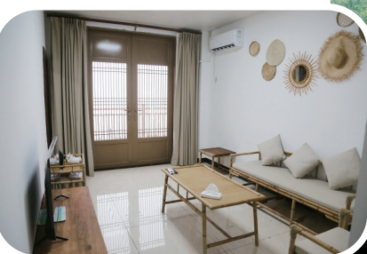
马安村村民开设民宿增收致富。