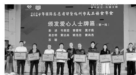
为爱心人士颁发牌匾。