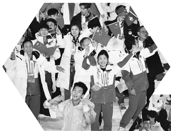
▲各体育代表团在闭幕式上。