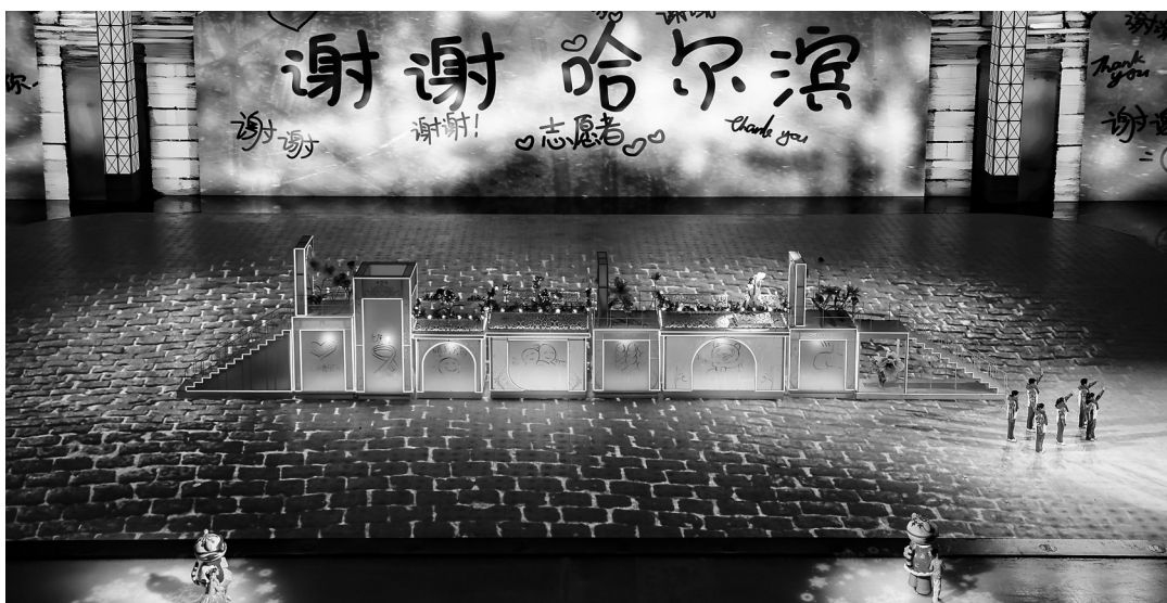
亚冬会闭幕式上的表演。

12日,阿联酋奥委会的两位工作人员踏上了回国的旅途。在哈尔滨期间,保障车辆驾驶员王明明、胡仁杰,成为他们离开时最想感谢的人。“谢谢你们!你们是最棒最好的司机!你们总是乐于助人,彬彬有礼,总是面带微笑,给予我们温暖,你们热情的性格让我们印象深刻!”阿联酋奥委会工作人员将自己的感谢之意写在笔记本上,并恳请志愿者帮忙将他们写的英语翻译成汉语,表达这份纸短情长的感谢。