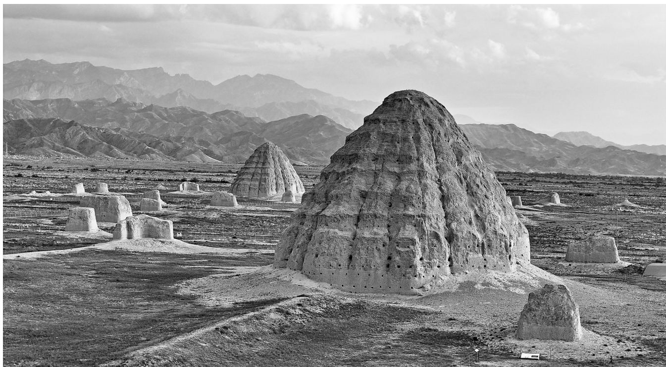
2025年7月10日在宁夏银川拍摄西夏陵1号陵与2号陵(无人机照片)。

从选址看,西夏陵符合中原王朝帝陵背山面水的传统。在陵寝布局上,西夏帝陵保存了传统帝陵中陵门、献殿、神道、石像生等构成要素,以及神道—陵城的轴线对称布局特征,但创造性地以类似辽塔的密檐式夯土实心高塔作为陵台,墓道封土则呈突出鱼脊状。在陵城中轴线外,献殿、墓道封土、墓室、陵塔构成北偏西的另一条轴线,体现了党项族的原始信仰。