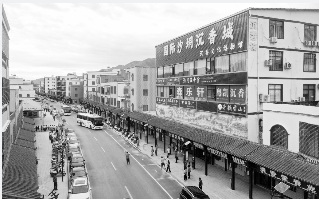
观珠镇沙垌沉香街。

观珠镇沙垌村沉香街,见证“中国沉香之乡”从沉香传统加工单一生产向农文旅三产融合的发展蝶变。去年,电白区建设沙垌沉香中心,打造沉香展馆、沉香主题民宿及制香体验工坊等,游客可参与古法采香、线香制作等工艺,从