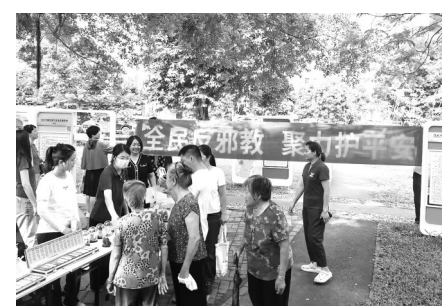
■记者 周娴 通讯员 钟春燕

本报讯 为进一步增强广大群众识别邪教、抵制邪教的能力,营造积极向上、健康和谐的社会环境,昨日,电白区水东街道办事处在新湖公园开展以“全民反邪教,聚力护平安”为主题的反邪教宣传活动(如上图)。此次活动吸引了约1000人参与,取得了良好的宣传效果。