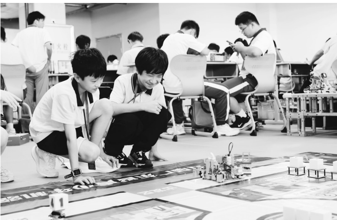
茂名市参赛选手在现场拼装调试。通讯员 刘洲 摄