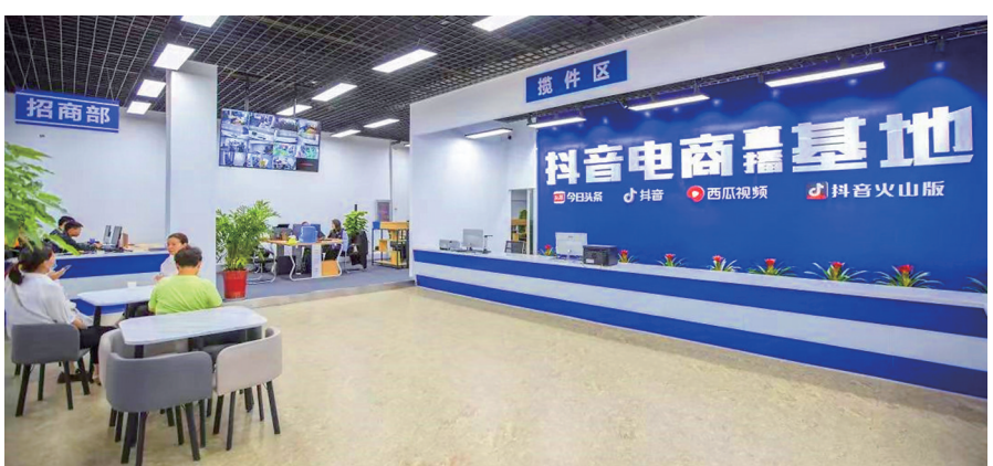
抖音电商直播基地。