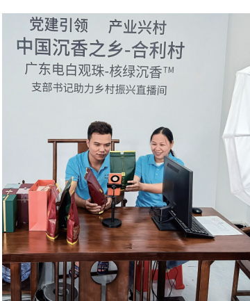
合利村党支部书记直播间。

建立镇村电商服务站。依托党群服务中心、红色驿站等建设镇村电商服务站,配备办公电脑、办公桌椅、货架、出货仪等电商设备,在沉香主产区镇村打造电商服务站19个,提供政策宣传、代买代卖、快递收发、人才对接、经验交流等综合性电商服务,让电商便利村民的同时也做好