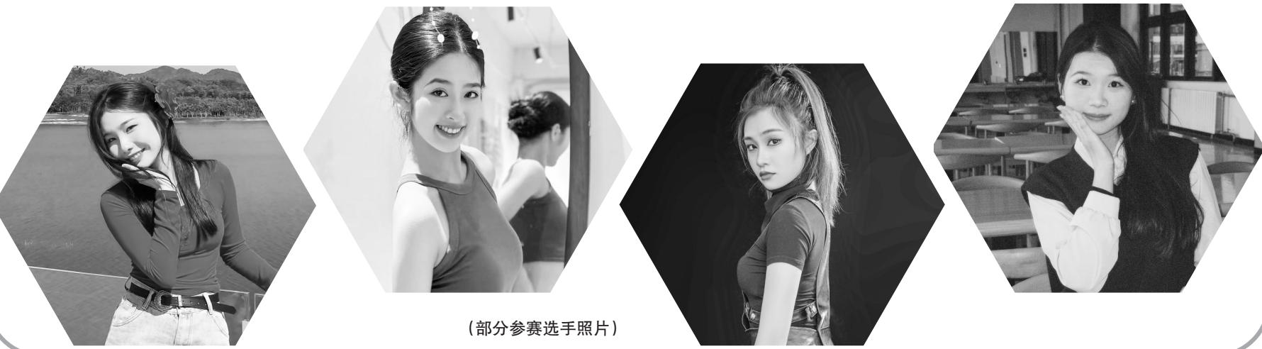
(部分参赛选手照片)

整个活动在热烈而温馨的氛围中圆满结束。此次高考奖学金颁发不仅是对优秀学子的表彰与鼓励,更是对林尘镇教育事业的有力推动和有效赋能。