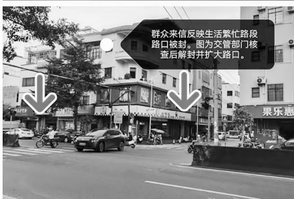
群众来信反映生活繁忙路段路口被封。交管部门核查后解封并扩大路口。