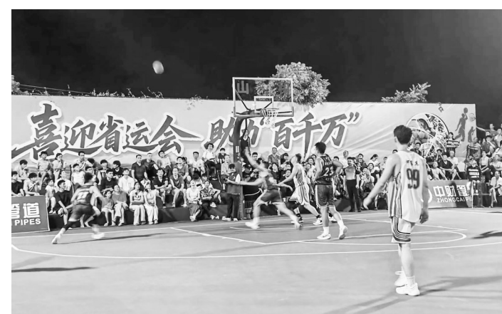
茂南区羊角和高州石鼓开展激烈对抗。

金腿、蛋黄莲蓉皮薄馅靓,色泽诱人;创新口味层出不穷,香甜扑鼻的展位前围满了品尝和选购的村民与游客。中医药文化体验区则弥漫着沁人心脾的草药芬芳,既有资深的中医师们坐诊为群众提供免费把脉问诊服务,也有经验丰富的推拿师现场施展技艺,为群众舒筋活络、缓解疲劳。互动游戏区更是欢笑不断,趣味横生的游戏项目前围满了跃跃欲试的人群,参与游戏的人们有机会将新鲜甜美的罗非鱼、荔枝冰淇淋等满载茂南风情的特色礼品带回家。与此同时,茂名国旅的文旅大篷车化身移动的欢乐大舞台,麦克风在热情的村民手中传递,嘹亮的歌声与台下观众的掌声、欢呼声汇成一片。而在“茂南农特产品展示区”,琳琅满目的本地优质农产品整齐陈列,成为展示“好心茂名,魅力茂南”物阜民丰的生动窗口,吸引着人