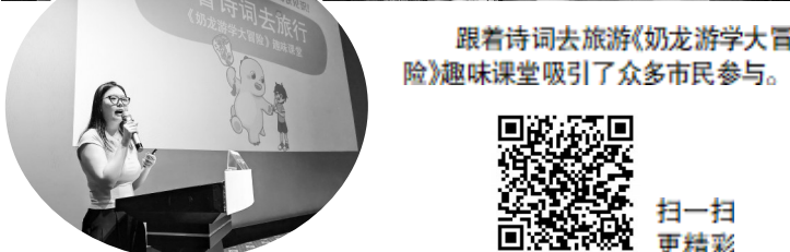
跟着诗词去旅游《奶龙游学大冒险》趣味课堂吸引了众多市民参与。