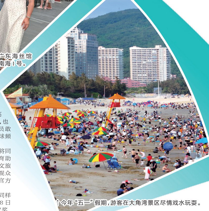
↑今年“五一”假期,游客在大角湾景区尽情戏水玩耍。