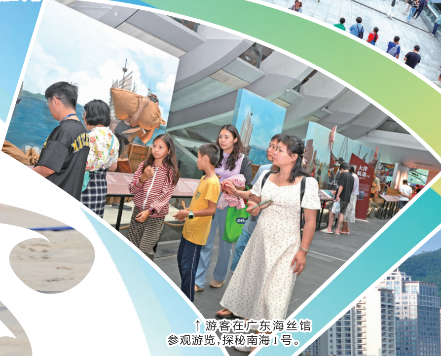
↑游客在广东海丝馆参观游览,探秘南海1号。