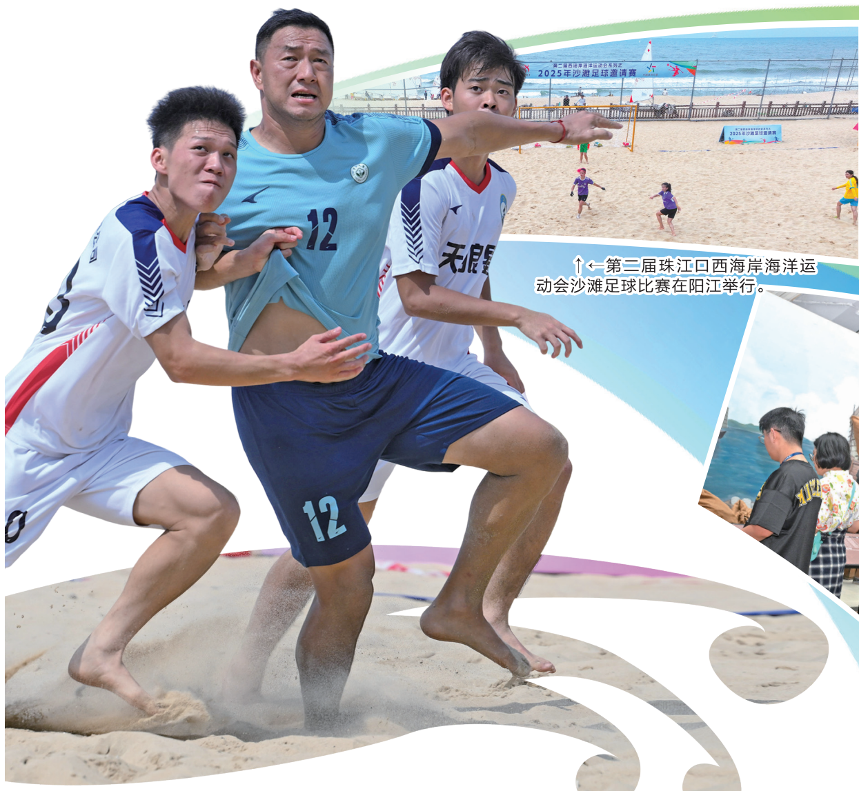
↑第三届珠江口西海岸海洋运动会沙滩足球比赛在阳江举行。