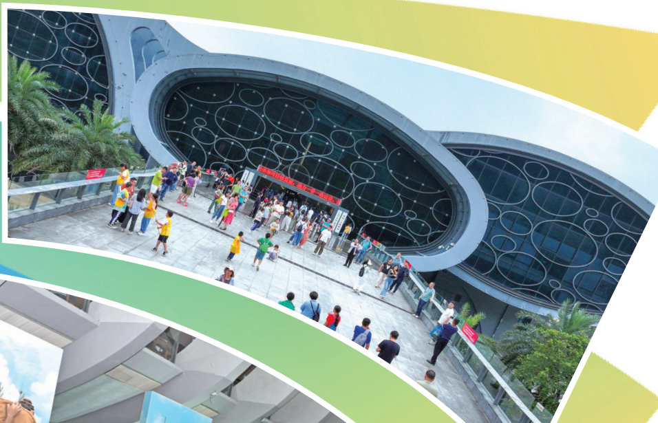
↑到广东海丝馆参观游览的游客络绎不绝。