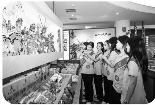
选手们来到包茂高速柏桥服务区采风集训。

引。作为国家级非遗项目,通过数字化光影与实物展示相结合的方式,生动呈现了沉香文化的深厚底蕴。