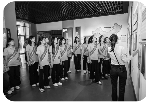
选手们来到中国荔枝博览馆参观采风。