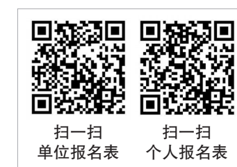
扫一扫 单位报名表

1.参赛作品的作者(或主创人员)姓名、单位等信息以报名表为准,原则上提交后不得修改。 2.一旦发现参赛作品存在抄袭、侵权等违规行为,主办单位有权取消其参赛资格及追回奖项,并保留追究法律责任的权利。 3.作品版权为参赛个人或参