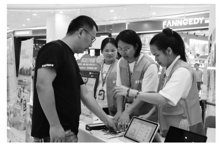
■文/图 记者 邓海菲 通讯员 刘甜

本报讯“带孩子玩转科技的同时,还学到了这么多实用的通信知识,这种贴心又新颖的服务形式,体验感很不错!”近日,茂名移动举办“移起探索,玩转科学”主题活动,将现场变身科技乐园与惠民驿站(如图),让广大市民趣味体验中触摸科技脉动,更让中国移动“十项服务承诺”以可感可触的方式,生动融入市民生活。