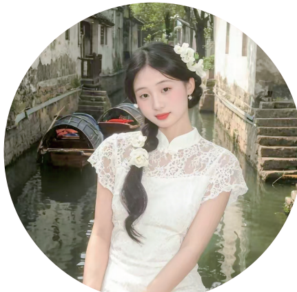
参赛宣言:以初心承洗夫人“和合”精神,用行动传岭南中帼风采,愿做文化传承的星火,为洗夫人精神的当代弘扬全力以赴!