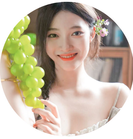
参赛宣言:用青春的舞步描绘出独属于茂名的诗。