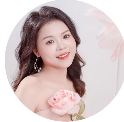
参赛宣言:有努力才会有实力,有实力才会有魅力。