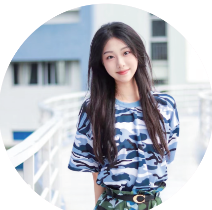
参赛宣言:以当代青年之姿,讲好“好心故事”。