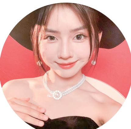
参赛宣言:舞台即战场,此刻,全力以赴!