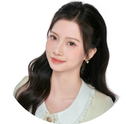
参赛宣言:要么做到尽善尽美,要么力争独占鳌头。