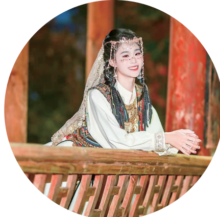
参赛宣言:舞出青春风采,传递“好心”力量。