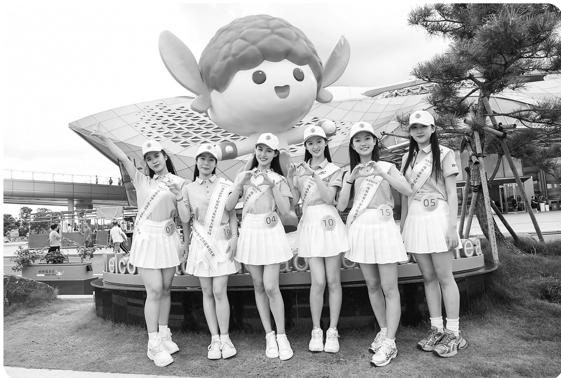
选手在柏桥服务区参观采风。

在中国荔枝博览馆,选手们沿着荔枝的起源、传播、品种和文化脉络,并在讲解员的讲解下,详细了解茂名荔枝的文化故事。一进展厅,“荔史”展厅以时间为轴,荔枝早在远古时期就已在华夏大地萌芽,那些古老的荔枝种植工具、不同朝代文人墨客对荔枝的吟