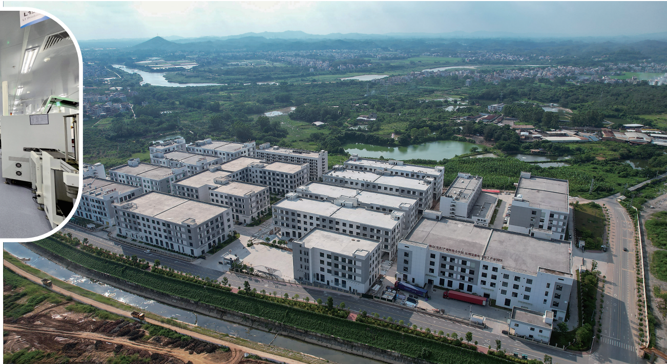
▶高州蒲康工业园俯瞰。