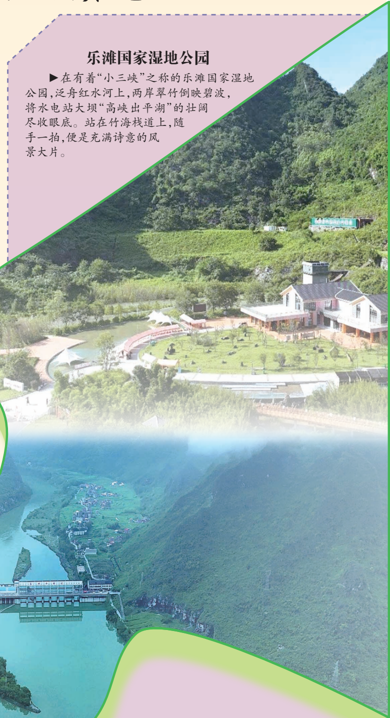
▲红水河生态旅游区风光。

▲在有着“小三峡”之称的乐滩国家湿地公园，泛舟红水河上，两岸翠竹倒映碧波，将水电站大坝“高峡出平湖”的壮阔尽收眼底。站在竹海栈道上，随手一拍，便是充满诗意的风景大片。