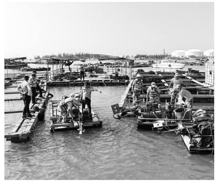
海洋综合执法人员在海上检查涉渔“三无”船舶。

本次行动累计出动执法人员近123人次,海洋综合执法艇6艘次、吊机3辆次、专业拖船1艘次、钩机2辆次、无人机2架次,经过两天奋战,海上共扣押涉渔“三无”船舶23艘回执法基地,岸上现场拆解68艘,有效遏制涉渔“三无”船舶违法行为,为维护茂名市海域渔业生产秩序和海洋生态安全筑牢屏障。