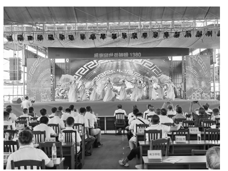
文艺表演。

当天,活动举行了校友、乡贤助力母校发展捐赠仪式,并向校友会成员颁发聘任证书、牌匾。随后,各级领导、历届校友、热心乡贤与分界中学师生欢聚一堂,畅所欲言,共同为分界中学的未来和当地教育事业的发展出谋划策,现场气氛温馨热烈。最后,该校还为现场嘉宾献上了一场内容丰富、精彩纷呈的文艺表演,为学校120周年庆典活动画上了一个完美的句号。