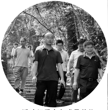
活动组委会各成员单位多次“地毯式”踩线勘察。