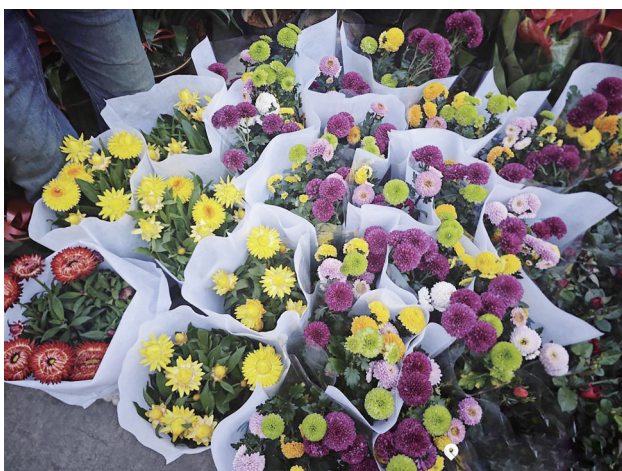
多彩的菊花。

白居易在《重阳席上赋白菊》说:“满园花菊郁金黄,中有孤丛色似霜。还似今朝歌酒席,白头翁入少年场。”重阳节古来又称“菊花节”,菊花是长寿之花,又是文人笔下凌霜不屈的象征。菊花酒又被看作重阳必饮、祛病祈福的吉祥酒。农历九月,菊花盛开,赏菊花、饮菊花酒便成为重阳节的习俗之一。