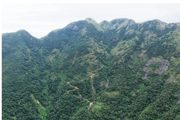
“2025 茂名浮山岭重阳登高活动”将于 10 月 25 日举行。图为浮山岭。

杜牧的《九日齐山登高》:“江涵秋影雁初飞,与客携壶上翠微。尘世难逢开口笑,菊花须插满头归。但将酩酊酬佳节,不用登临恨落晖。古往今来只如此,牛山何必独沾衣。”重阳节又称“登高节”。据了解,重阳登高这一习俗,源于古人对山岳的崇拜。登高也有“高升”“高寿”之意,重阳节后,天气渐寒,草木枯黄,此时登高也被称为“辞青”,与古阳春三月的“踏青”相对应,老人会在重阳节当天通过登高来强身健体、祈福长寿。