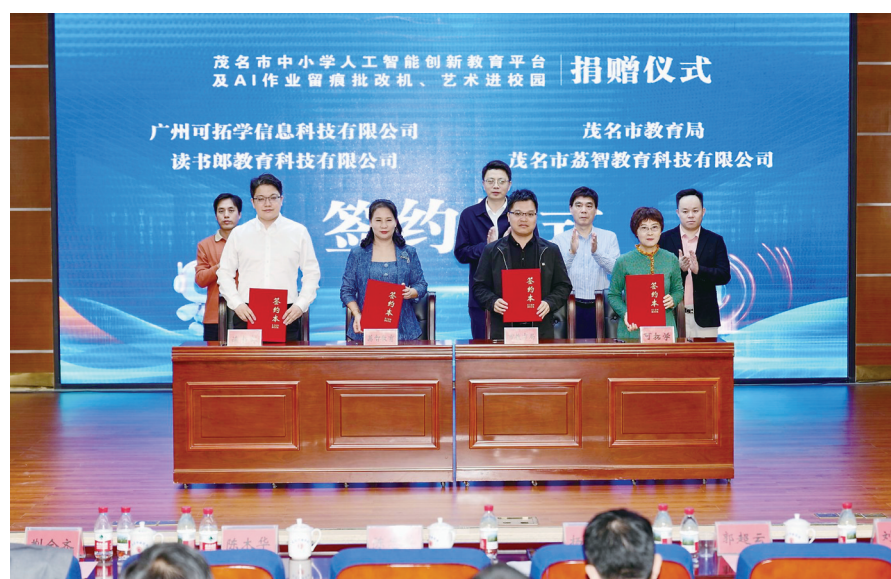
正服务于师生成长,助力教学提质增效。市教育局、市农文旅集团有限公司、市荔智教育科技有限公司、广州可拓学信息科技有限公司、读书郎教育科技有限公司、北京师范大学未来设计学院、大鹏美育(广东)文化科技有限公司等单位代表及市、区(县级市)教育局相关负责人、受赠学校代表参加活动。

受赠单位市教育局有关领导对市农文旅集团有限公司及各捐赠单位的善举表示衷心感谢,并指出,本次捐赠的AI作业留痕批改机、爱学网平台及艺术教育设备,既贴合教学实际需求,又契合教育数字化转型趋势,将有效提升教学效率、丰富美育实践形式,为茂名落实教育数字化战略行动提供坚实支撑。希望各受赠学校珍惜资源,用好用活,让智能化设备真