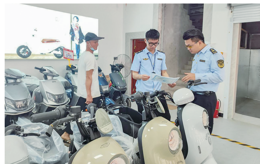
价格不合理问题4宗,为消费者挽回经济损失超万元。这些数据既是监管效能的体现,也是群众安全感的有力保障。

协同治理,破解监管难题。面对电动车行业“内卷”竞争带来的潜在风险,该分局联合公安、消防等部门打破壁垒,协同推进、靶向发力,严厉打击“擦边球”行为,深挖隐性违法,织密“监管一张网”。执法重点聚焦行业痛点,覆盖电池质量、非法改装、配件溯源、假冒伪劣、无效认证、“三无”产品、不明码标价、无证经营等多个方面,推动整治工作从“头痛医头”的碎片化监管转向“全面体检”的前瞻性治理。据统计,今年以来,该分局通过“综合查一次”覆盖检查销售、维修等经营主体,已整改问题2处,立案查处3宗,没收不合格产品3台,处罚款17500元,处理投诉电动车