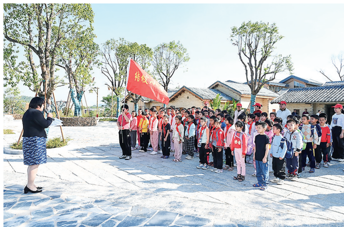
结坡小学师生到砺儒教育文化史馆进行研学活动。