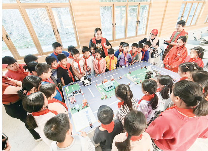
现代科技让学生们大开眼界。