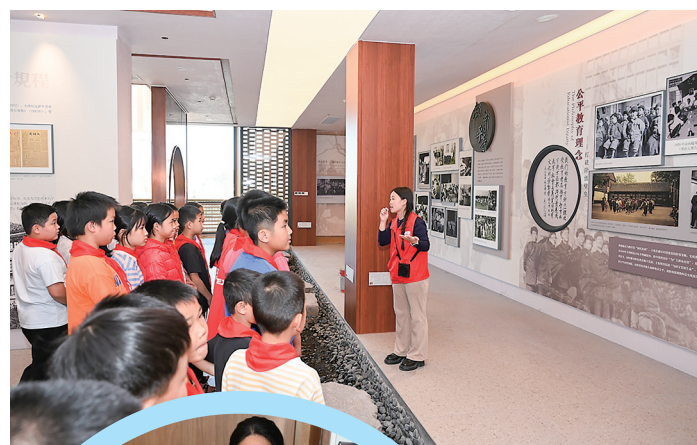
▲学生们在听讲解员讲解。