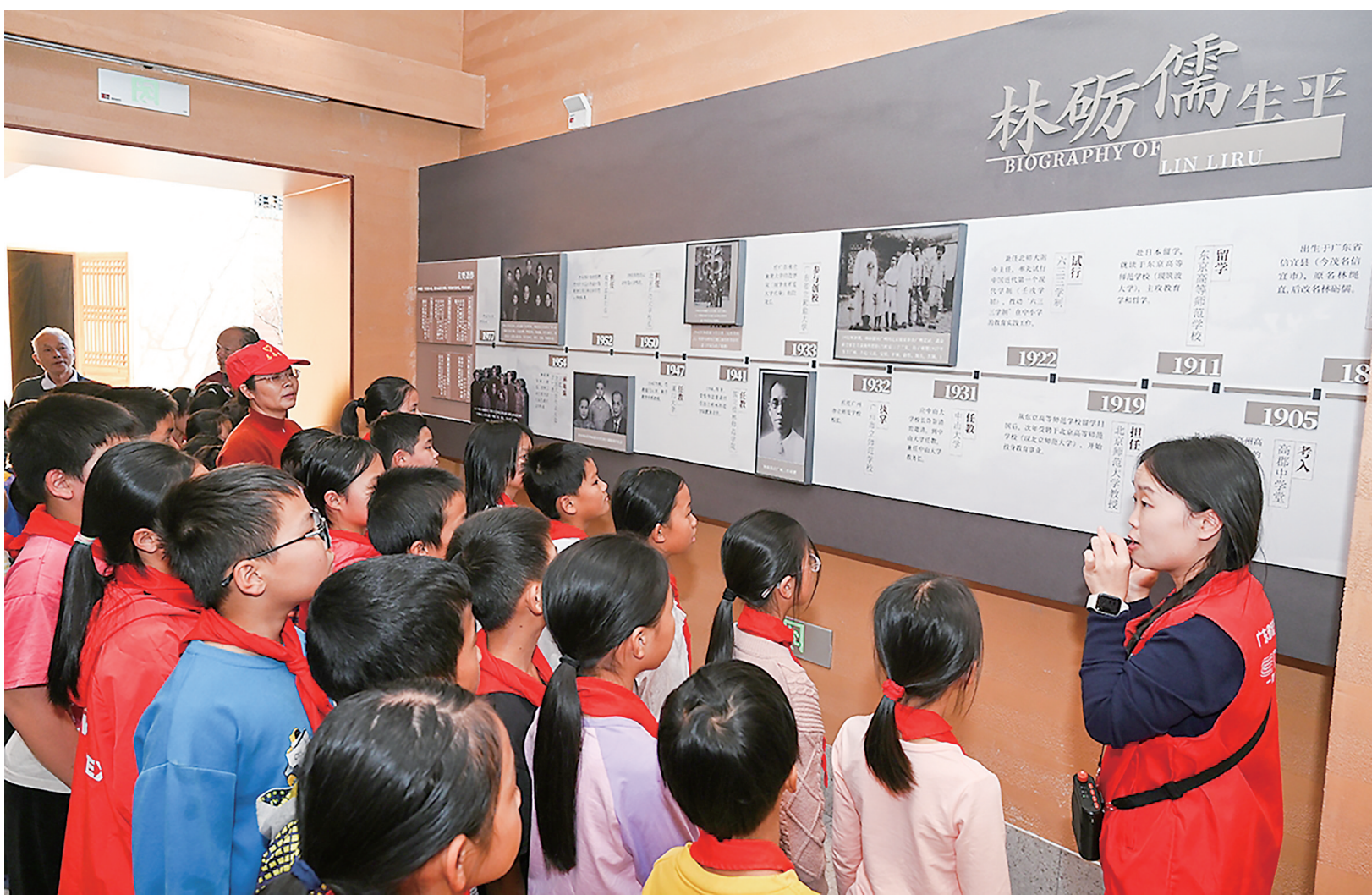
学生们在参观砺儒教育文化史馆。

据了解,砺儒教育文化史馆建设积极响应国家“科教兴国”战略和“双减”政策要求,打造“文化传承+科技创新”的特色研学模式。整个项目将建设成为弘扬教育家精神的重要阵地、培养创新人才的重要平台。秉承“师道砺儒,薪火传承”的理念,将砺儒教育思想与现代科技深度融合,培养既有文化底蕴又具备创新能力的新时代人才。整个项目通过进一步强化文化精神、文化情感、文化情怀的淬炼,并依托当地农业基础和生态资源禀赋,推动农文旅融合发展,建设宜居宜业和美乡村,助推“百千万工程”取得更大实效。