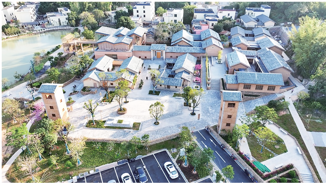
俯瞰砺儒教育文化史馆。