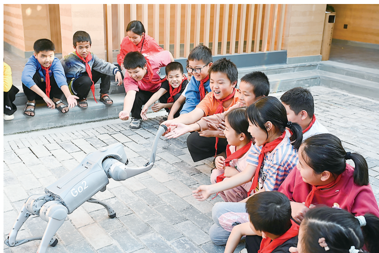
学生们开心地与宇树机器人互动。