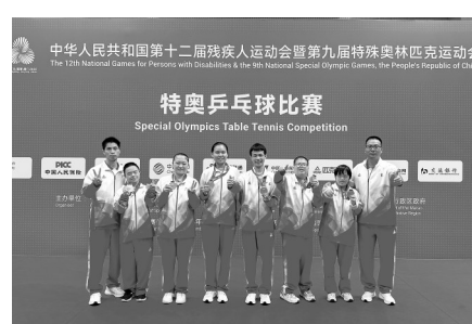
市特校参赛队员与教练合影。

12月10日，参赛队员归校后，又立即投入了新一轮的训练，为明年在茂名举办的省残运会备战，力争为更好的佳绩而努力奋斗。