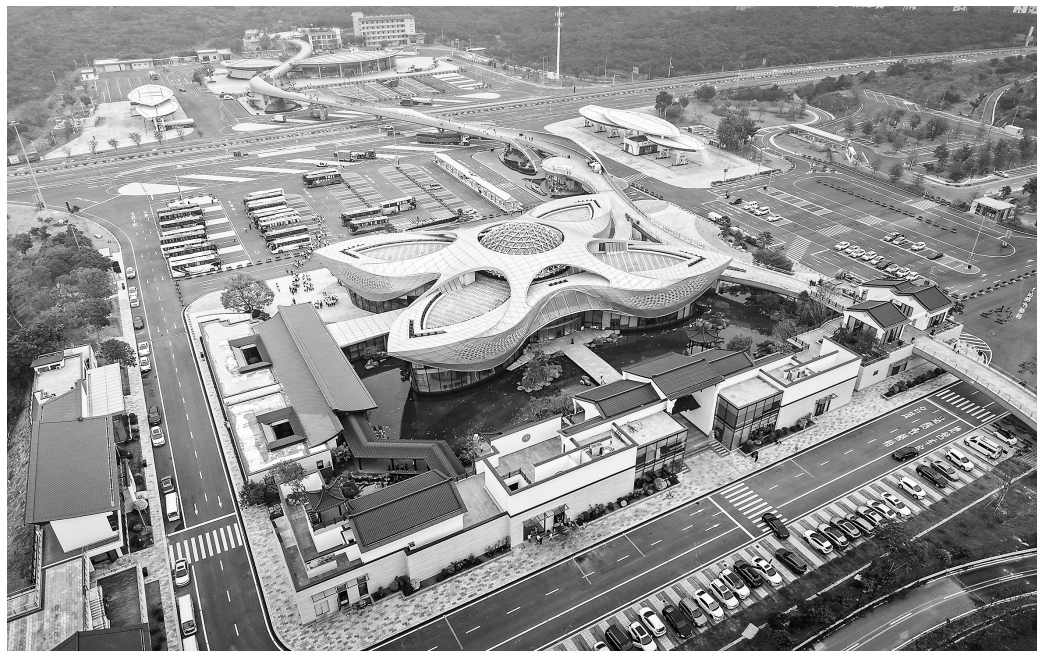
柏桥服务区。