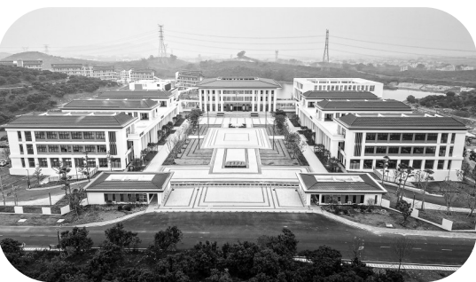
茂名市委党校新校区。