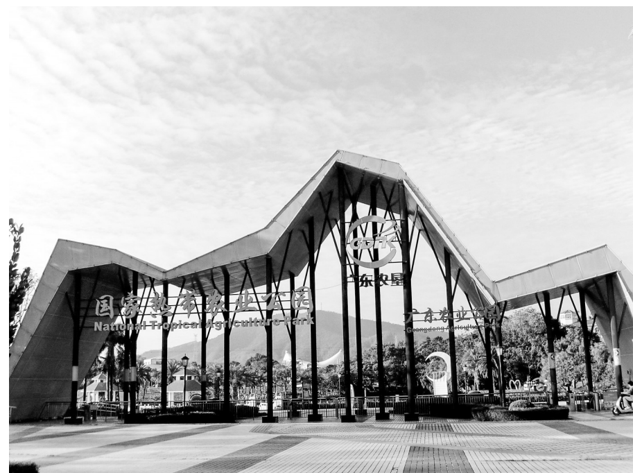
广垦(茂名)国家热带农业公园正门。

南药守护健康,运动塑造体魄。本次化州分会场徒步活动,既是践行全民健身国家战略的具体行动,也是展示化州“南药+体育”融合发展和“百千万工程”三年初见成效的重要窗口,更是凝聚全民力量、推动化州高质量发展的生动实践。活动诚邀广大市民踊跃报名、积极参与,相约橘洲,以铿锵步伐丈量发展成果,以昂扬姿态助力县域振兴,共同为茂名在市域发展、县域振兴中走在粤东粤西粤北前列注入强劲动力。