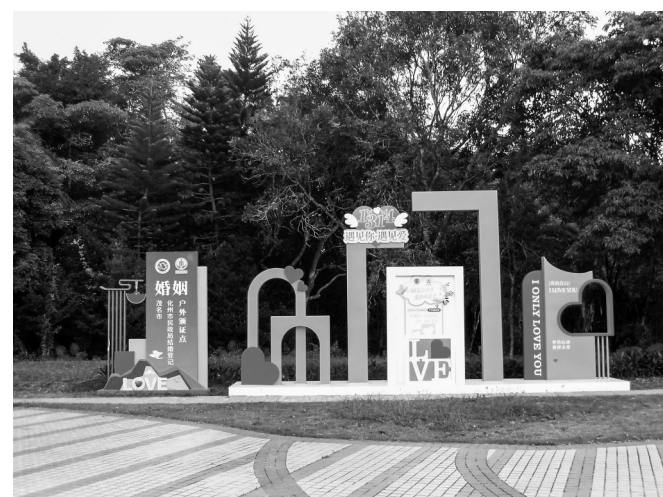
中央广场的结婚登记户外颁证点。