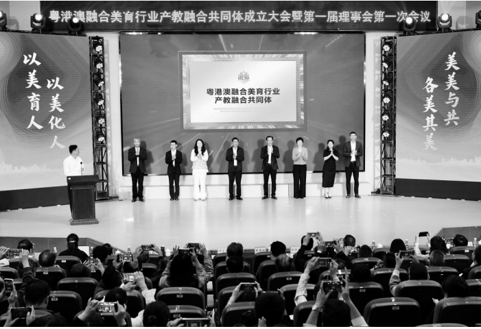
粤港澳融合美育行业产教融合共同体揭牌。

据了解,共同体创新采用“双高校引领、龙头企业驱动、多元主体协同”的共建机制。其中,华南师范大学作为国家“211工程”重点建设高校及全国美育教学指导委员会主任单位,提供顶层设计与学术支撑;广东茂名幼儿师范专科学校是全国艺术教育特色单位,在美育教学、非遗传承领域积淀深厚,拥有多个省级以上平台与专业群,是重要的实践育人基地;茂名农文旅集团作为区域文旅产业龙头,则链接市场端,为成果转化与产业对