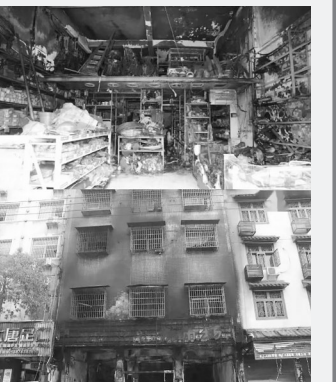
“三合一”场所火灾后真实图片。火措施，才能远离火灾威胁，不让经营住所变火场，守护好自己和家人的平安。

消防安全无小事，生命安全大于天。经营性场所的防火知识不是无关紧要的常识，而是守护生命的必修课。唯有人人认清隐患、熟知防范要点，落实防