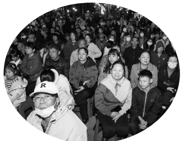
◀市民兴致勃勃地观看表演。