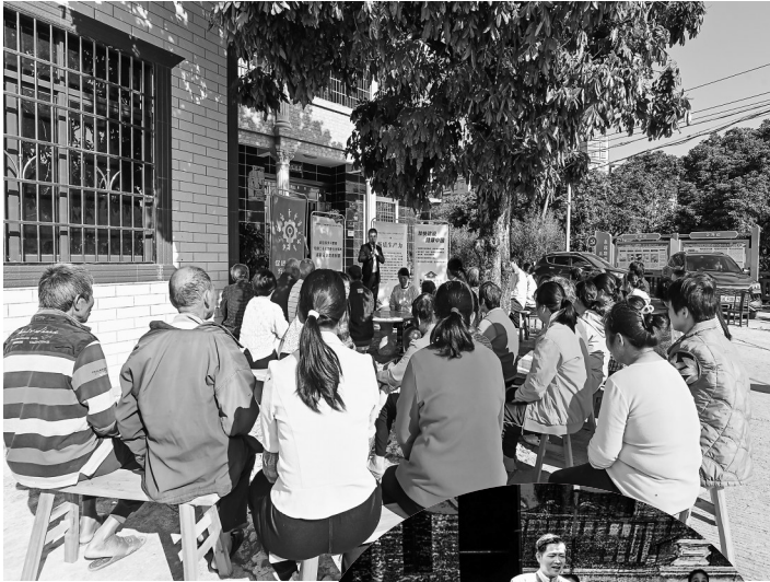
▲“信宜红话筒”宣讲员走进东镇街道宣讲。

信宜宣讲模式的成功，核心在于始终坚守“以人民为中心”的发展思想，把群众满意度作为检验工作的根本标准，让宣讲成效最终体现在民生改善、发展提质上。“信宜红话筒”宣讲队伍扎根田间地头、村社广场，用信宜话、客家话拉家常、解疑惑，不讲空话