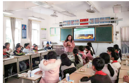
信宜二中的老师与白鸡小学高年级学生进行交流。

茂名市市场监管局相关负责人表示,将继续加强对驻村工作的指导,充分发挥驻村第一书记的桥梁纽带作用,持续深化“信宜二中——白鸡小学”帮扶机制,推动开展课堂教学、师资培训、文化交流等形式的交流活动,以党建引领凝聚帮扶合力,补齐乡村教育短板,为全面推进乡村振兴、促进教育均衡发展贡献市场监管力量。