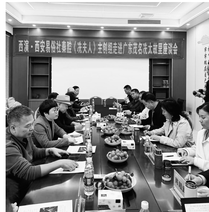
西演·西安易俗社秦腔《洗夫人》主创走进广东茂名洗太故里座谈会

据了解,秦腔《洗夫人》的创排,是传统戏曲传承创新的一次有力尝试,也为茂名洗夫人文化活化利用提供了崭新的艺术视角。秦腔与岭南文化的这次跨界融合,正谱写一曲跨越山海的南北文化和鸣。