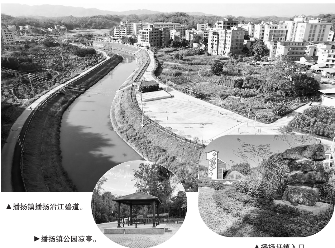
▲播扬镇播扬沿江碧道。