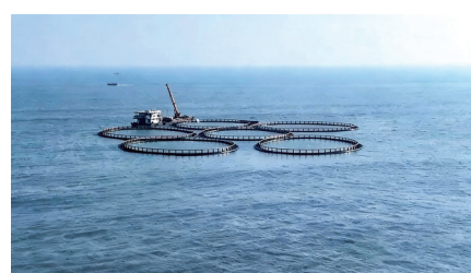
多个网箱分批入海,并按规划位置锚定。

新城集团有关负责人表示,该项目是该集团积极响应国家政策号召,开拓海洋牧场的首次落地,标志着集团在海洋经济领域的战略布局迈出新的实质性步伐。同时,项目将有力推动电白区现代海洋渔业转型升级,实现生态养殖与可持续发展。