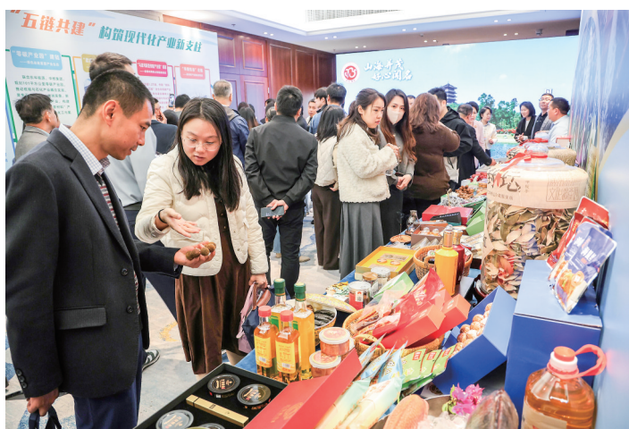
发布会现场布置了茂名特色展区。

“五链”共建成果通过展板清晰呈现:“茂名石化”升链、“零碳产业园”建链、“欣旺达电白基地”延链、“马店河新型储能产业园”拓链、“华南钛谷”壮链。五年来,