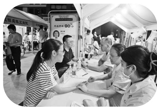
中医药健康夜市为群众义诊。

产业根基的稳固，更催生出文旅融合的新场景。茂南、化州等地的中医夜市，正以浓浓的烟火气点燃市民的养生热情。由茂名市中医医院研发的化橘红秋梨膏，将传统膏方工艺与现代科技结合，让古籍中的“消痰圣药”变身便携养生好物，在中医夜市摊位上常常供不应求。近年来，茂名以西晋名医潘茂名的中医药文化为牵引，打造了“潘茂名中医药健康夜市”这一特色品牌，让中药香