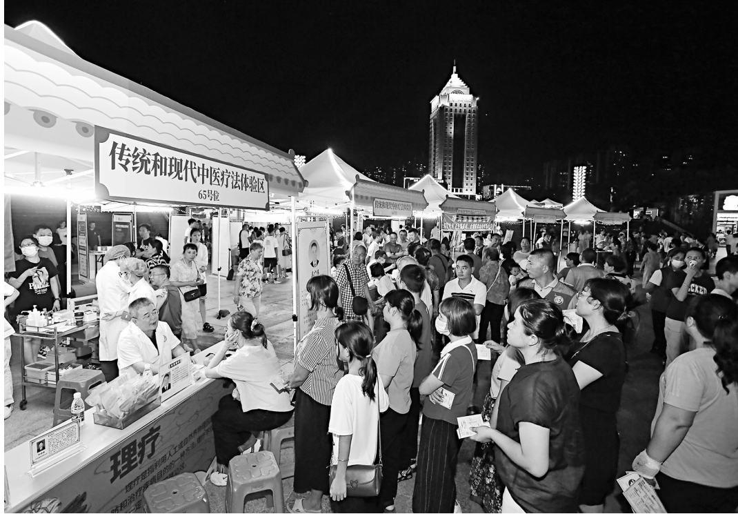
我市举办“潘茂名”中医药健康夜市吸引了众多市民前往“逛夜市”。

文化传承的热潮背后，是产业发展的铿锵步伐。化橘红国家地理标志保护示范区成功获批，这是粤西首个国家地理标志保护示范区。示范区建设四年间，我市化橘红产业在经济效益、社会效益、生态效益和辐射带动方面均取得瞩目成就。全产业链年产值从创建前的49亿元飙升至115亿元，用标企业直接年产值达42亿元，种植面积达13.2万亩，年产鲜果7.5万吨、干果1.5万吨，带动35万余人实现就业增收，户均增收2.8万元，为康养经济提供了坚实的产业基础。