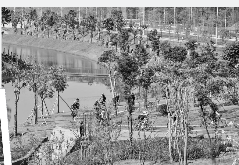
山水信宜·古今巡礼环线沿途风景。通讯员 陆波 郑运摄