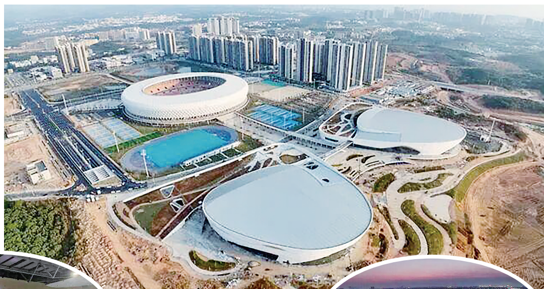
航拍镜头下的体育馆与游泳跳水馆。

游泳跳水馆除了承接全国性游泳、跳水等赛事,还能满足普通市民的需求,集赛事、训练、健身、休闲于一体。游泳跳水馆总建筑面积7.4万平方米,内设2007个座席,馆内规划了5个功能各异的泳池:跳水池、训练池、比赛池,以及两