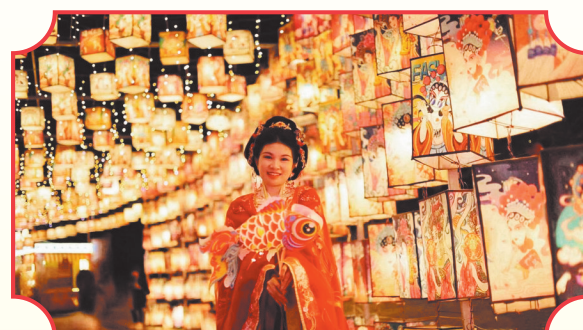
典故灯景,千载文心今夜亮,一灯一境一乾坤。