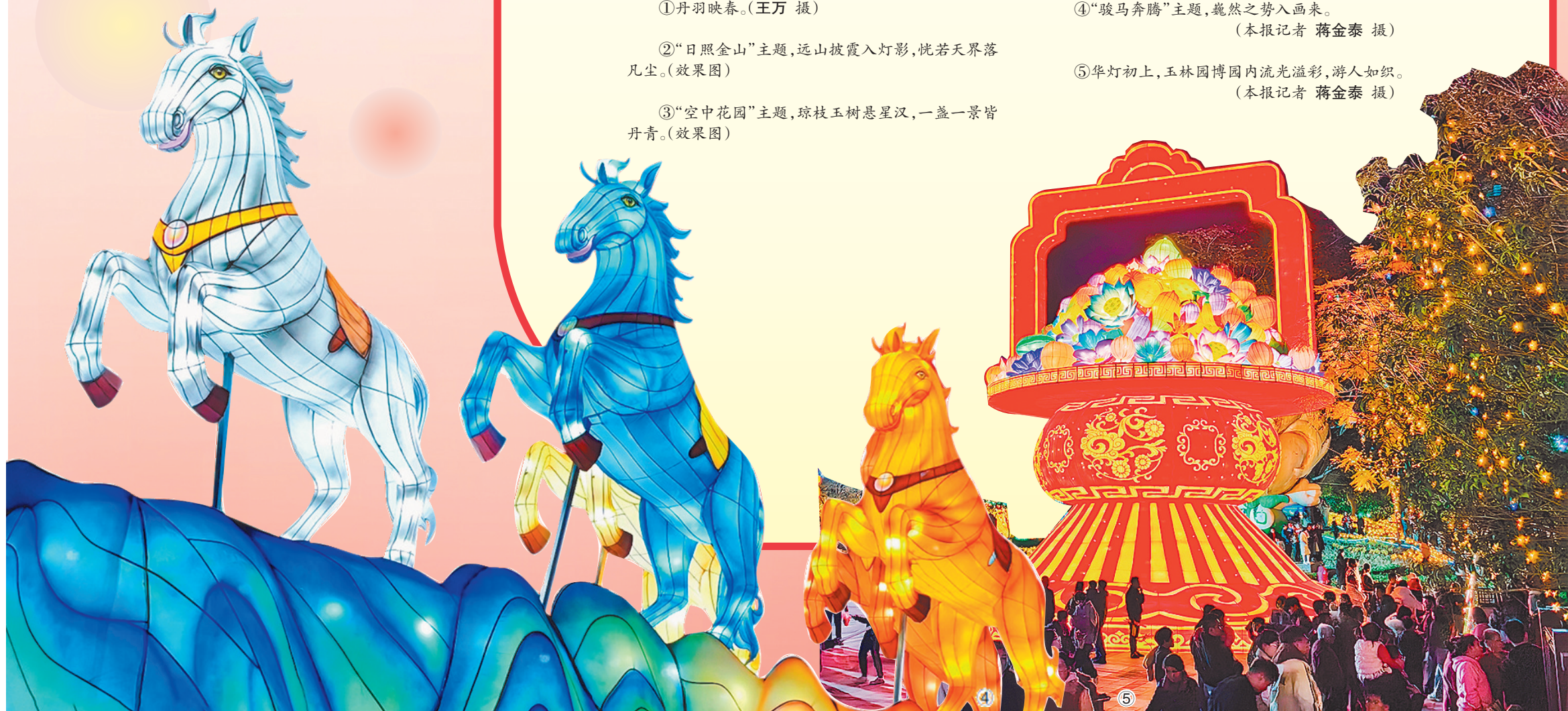
⑤华灯初上,玉林园博园内流光溢彩,游人如织。