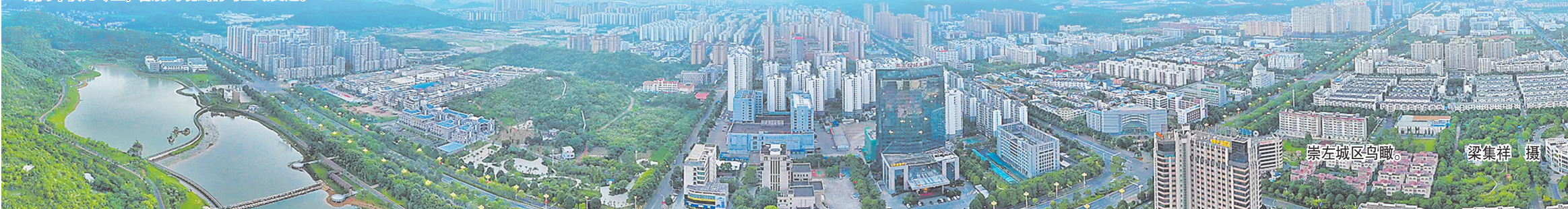
崇左城区鸟瞰。