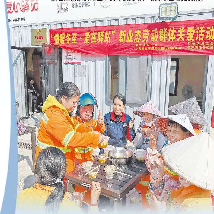
中国石化广西崇左石油分公司联合工会系统在江北加能站等23座具备条件的司机之家、爱心驿站举办“春暖冬至·爱在驿站”新业态劳动者关爱活动。