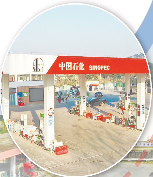
坐落于太平古城景区附近的江北加能站，集充电、加油、洗车与易捷便利服务于一体，是服务城市文旅发展与民生保障的重要窗口。

“十四五”期间，中国石化广西崇左石油分公司投入巨资对油库实施了三次重大技术升级和安全环保改造。通过搭建先进的安全监控联锁平台，将视频监控、罐区紧急切断、泵阀与液位联锁、可燃气体报警以及AI视频智能识别等系统集成于中控室，实现了对油库作业全过程的智慧化、可视化管控。同时，全面推进全流程密闭收发油和储存工艺，从源头控制挥发性有机物（VOCs）排放，用实际行动守护着左江流域的碧水蓝天。这座“能源心脏”的每一次跳动，都彰显着央企在安全生产和环境保护上的责任担当。