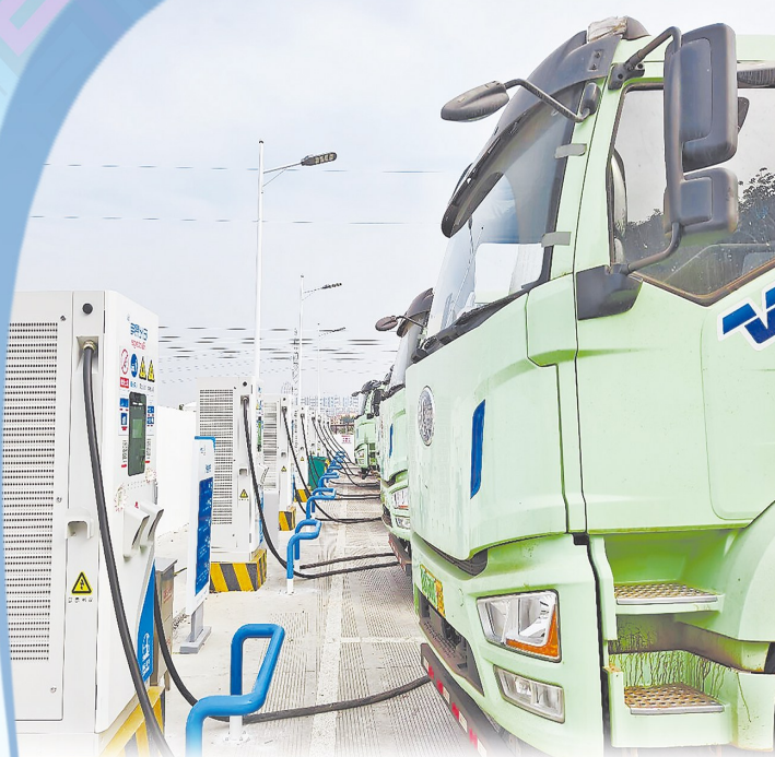
崇左江州加油站重卡货车快充站，助力绿色物流发展。