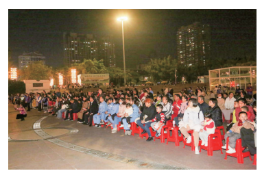
精彩节目吸引众多市民观赏。