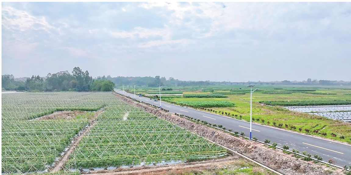
2025年投入2.58亿元资金建设“四好农村路”,进一步畅通城乡交通微循环。

省“百千万工程”专项资金的高效使用更彰显财政担当。截至2025年12月31日,21.65亿元省级