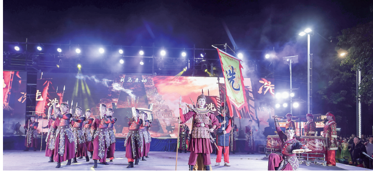
广东茂名幼儿师范专科学校学生表演的大型舞蹈《洗太舞》。

此次迎春晚会系列活动共分三场,每场节目精彩纷呈,尤其是第二场,演出在气势磅礴的非遗《群狮贺岁+洪拳》表演中热烈开场,点燃了全场气氛。随后,由公馆镇文化站艺术家们带来的民乐合奏《赛龙舟锦鲤胜令》以激昂旋律奏响奋进之音。展现本土精神内核的粤曲《洗太归降》与大型舞蹈《洗太舞》相继登场,深情弘扬了洗太夫人的家国情怀。古琴独奏《致乃》带来宁静悠远的古韵,而歌伴舞《亲爱的你啊》、男声独唱《中国喜洋洋》则传递出温馨的新春祝福。舞蹈《竹枝词》《醉清风》以激昂国风舞韵,女声独唱《玛依拉变奏曲》与萨克斯合奏《生命之杯》则融汇中西,点燃了现场热情。