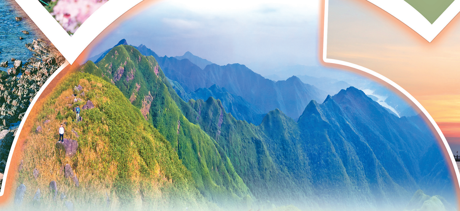
冬日的十万大山。