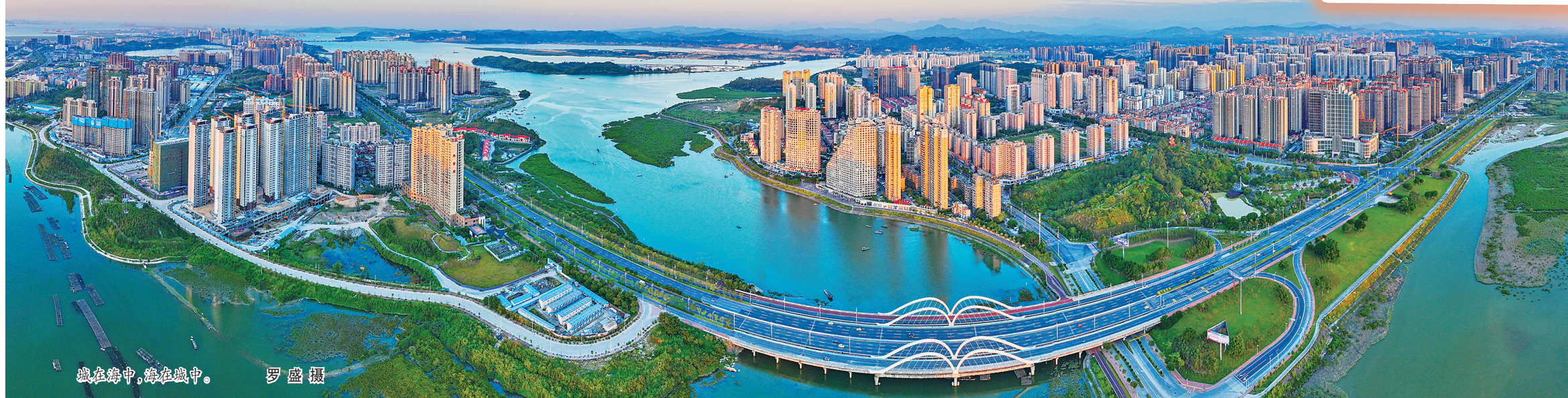
城在海中，海在城中。