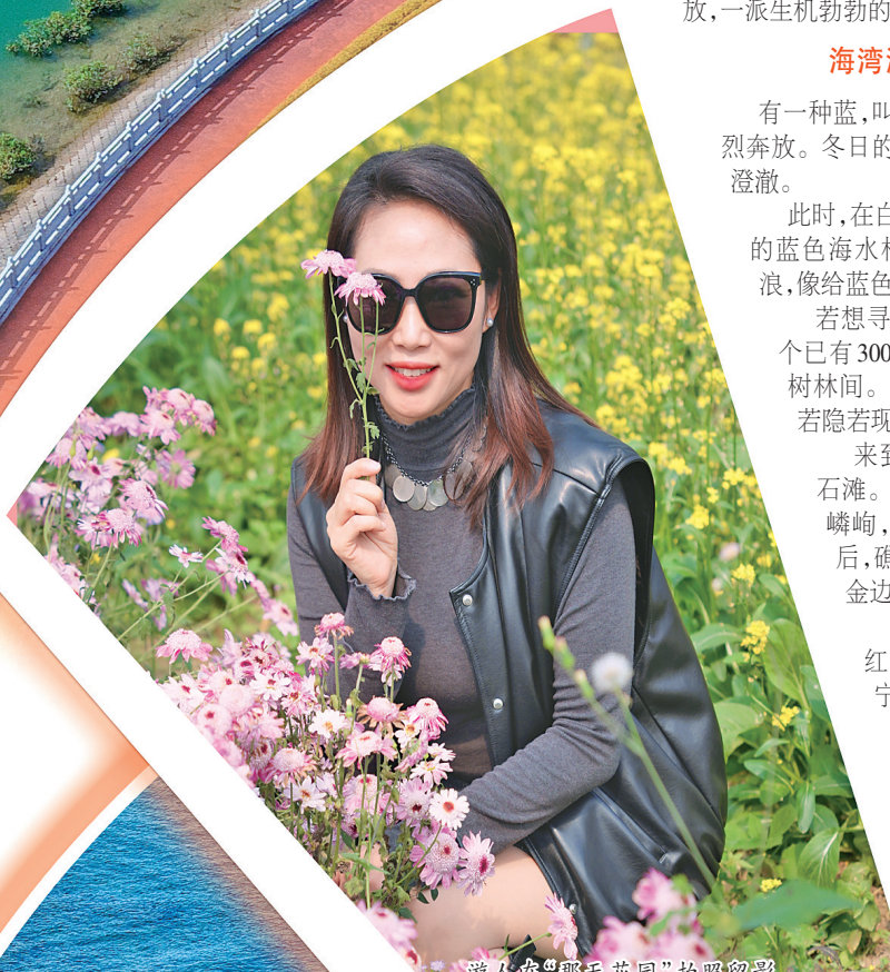
游人在“那天花园”拍照留影。