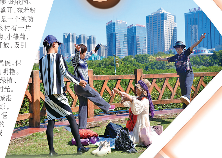
旅居者在北部湾海洋文化公园休闲。