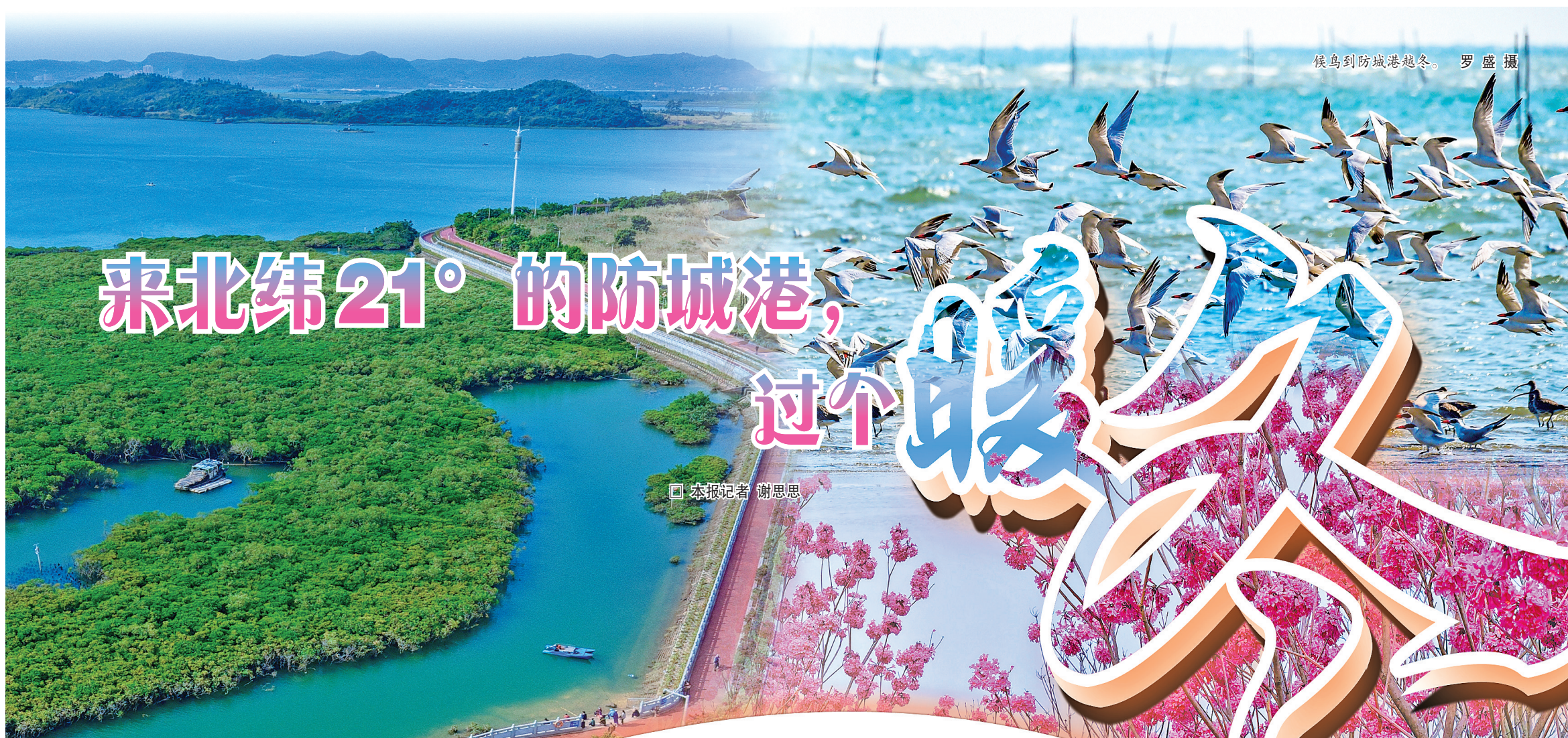
候鸟到防城港越冬。