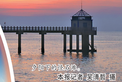
夕阳下的怪石滩。