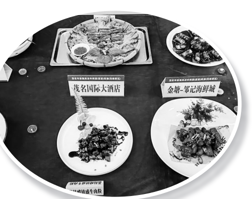
“赏非遗 品年例 过大年”茂名市首届高凉年例宴(喜宴)竞赛参赛菜式