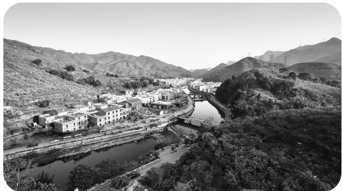
钱排镇双合村“山水双合”和李花谷瀑布

茂名本土文艺活动通过深入挖掘中华优秀传统文化与本土文化内涵,深受群众欢迎。其中,“百花迎春”茂名文艺界新春联欢晚会暨2025“好心茂名”网络春晚和2025“好心茂名”网络少儿春晚,通过线上线下联动,生动展现地方特色与青春活力,吸引了广大市民热情参与。此外,我市成功举办第十届荔枝文化形象大使全国选拔赛和第六届北部湾城市群冼夫人文化宣传大使选拔赛,以赛事为载体,传播荔枝文化与冼夫人“好心精神”,展现了城市独特魅力,有效提升了城市文化品牌的亲和力与影响力。这一系列贴近群众、富有特色的文化活动,共同构筑了本土文化盛宴,显著增强了市民的文化认同感与归属感。