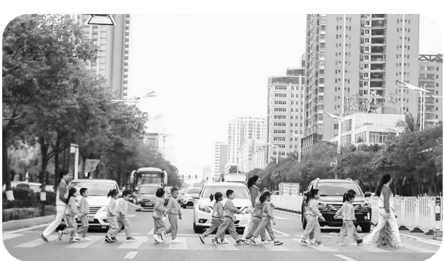
驾驶机动车文明出行,人行道前礼让行人

农业农村部官网发布《2025中国美丽乡村休闲旅游行(春季)精品景点线路推介》,其中信宜李乡游山赏花之旅线路成功入选。信宜作为全国三华李生产的龙头市(县),近年来持续做大做强三华李产业,走好产业振兴之路。该市依托三华李省级现代农业产业园等产业平台和便利服务设施,打造了“沿云茂高速农文旅结合带”,推动农文旅深度融合。此次入选的李乡游山赏花之旅线路,正是农文旅融合成果的生动彰显。