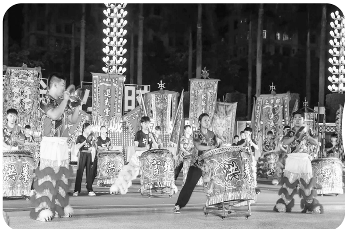
茂名非遗半小时活动现场

2025年,茂名市深入实施文化强国战略,以“百县千镇万村高质量发展工程”为牵引,全面推进文化强市建设。一年来,茂名紧扣高质量发展主题,推动优秀传统文化创造性转化、创新性发展,成功擦亮“好心精神”、荔枝文化等特色名片,实现文明创建与文化惠民双丰收。从“非遗半小时”常态化展演到荔枝嘉年华联动全域,从“金像摄影村”落地到美丽乡村旅游线路获荐,一系列举措生动彰显了文旅深度融合与城乡精神文明建设的最新成果,为茂名加快打造宜居宜业宜游的现代化滨海城市注入了澎湃文化动能。值此2026年茂名“两会”前夕,本报推出回眸奋进路迎接市“两会”文化篇,敬请垂注。