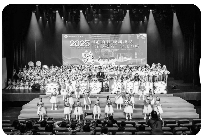
2025好心茂名网络少儿春晚

“茂名非遗半小时”自2025年3月16日起,每周六晚在文化广场大舞台持续呈现,常态化展演开启文化惠民新篇章。该活动是茂名深入实施文化惠民工程、推进文化强市建设的创新举措,是传承文化根脉、演绎文化魅力的重要平台,是提升城市品位、塑造文化品牌的有效途径。活动通过将非遗艺术与当下生活、时代精神的主旋律相联结,致力让市民群众在观看非遗表演的同时进一步增强文化自信,提升城市文明。活动不仅展示了茂名丰富的非遗文化,还通过城市文明知识问答互动环节增强市民对城市文明建设的认同感和参与感。