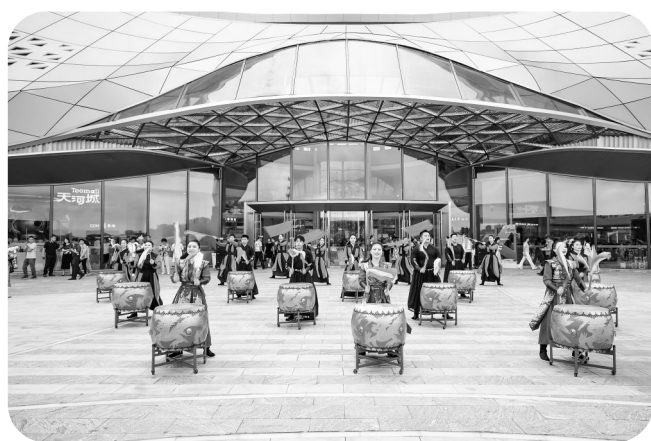
包茂高速柏桥服务区正式投入运营

2025年5月23日,在北京召开的全国精神文明建设表彰大会上,茂名市被中央宣传思想文化工作领导小组授予“全国文明城市”称号。茂名市于2017年9月正式启动创建全国文明城市工作。8年来,800多万茂名人民同心奋斗,推动城乡文明一体化发展,实现全域文明提升,城市面貌与基础设施进一步完善,广大市民也在创建过程中切实受益。