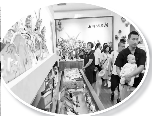
游客们参观服务区的非遗展览区