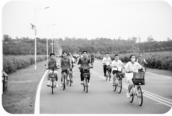
市民、志愿者们在露天矿生态公园的绿道上骑行游玩