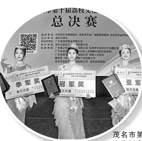
茂名市第十届荔枝文化形象大使全国选拔赛总决赛