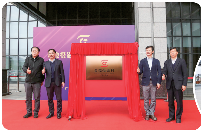
金像摄影村揭牌仪式现场

文/茂名日报社全媒体记者 陈珍珍 池榕