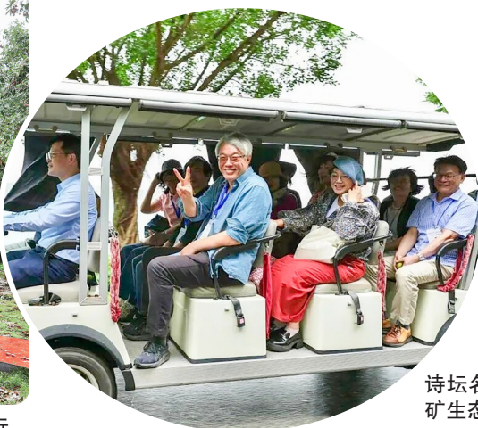
诗坛名家在露天矿生态公园打卡