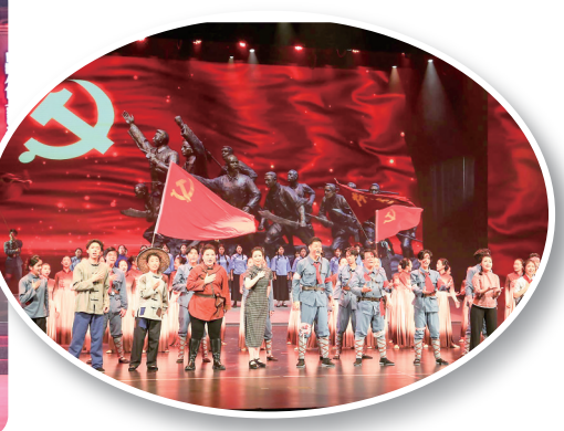
《怀乡起义》音乐剧第六幕《黄华江畔万里红》