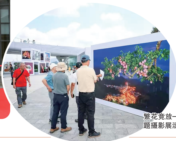
繁花竞放——荔枝主题摄影活动现场