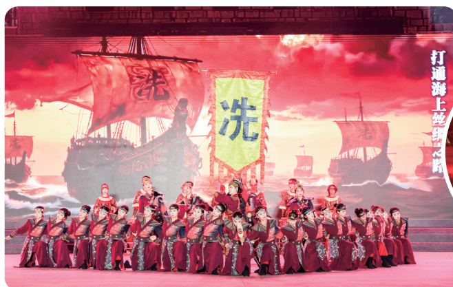
《茂名洗太舞》精彩表演现场

此外,置家墟依托特色街景、海景资源及“墟”文化,正加速建设文旅主题拍摄基地。自2025年11月以来,茂名南海岛影视创作氛围持续浓厚,短短两个月内,《双向蓄谋》等5部作品顺利完成取景拍摄。