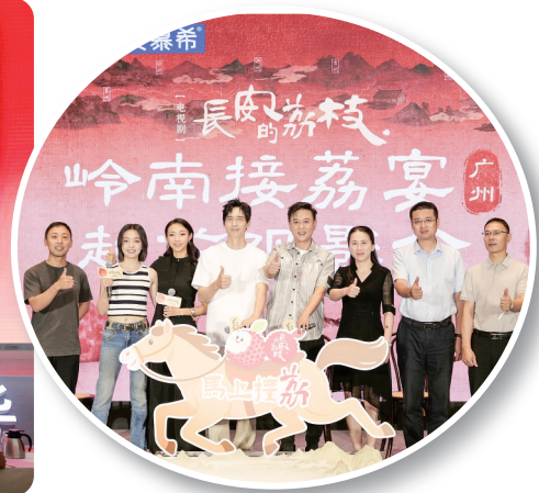
《长安的荔枝》主创艺人与领导嘉宾合影留念