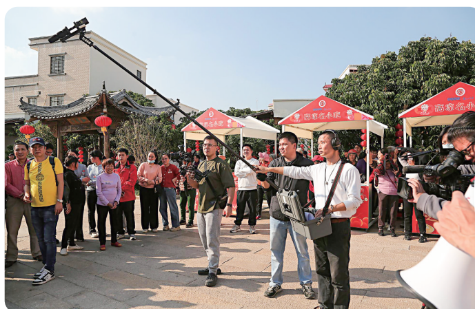
滩底微短剧基地将打造成中国微短剧第一村

这是一场以荔枝为主题的高规格诗歌盛会,极大提升了茂名的文化辨识度和旅游吸引力,为文旅融合发展注入了强大的文化内涵和品牌价值,开辟了“诗歌+文旅”的特色路径。