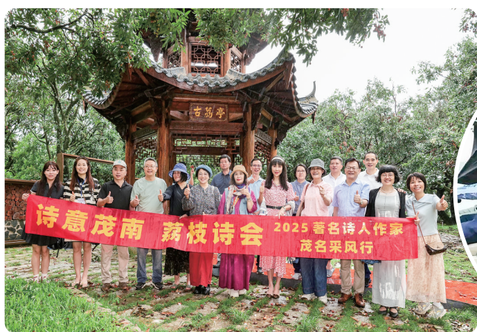
诗意茂南·荔枝诗会6月14日在禄段古荔园举行

期间,茂名借势《长安的荔枝》热映的东风,将千年荔枝文化推向全球视野,并通过荔枝文化节、荔枝嘉年华等创新形式,成功打造出独具影响力的“节庆经济”与文化盛宴。