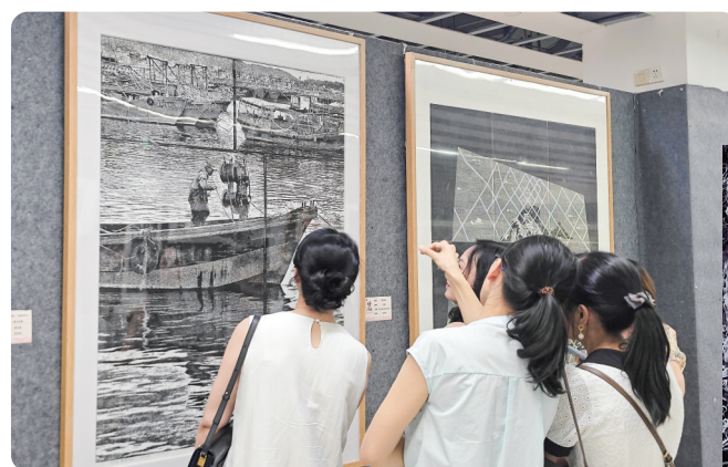
第二届“好心杯”全国版画创作大展现场

2025年11月9日晚,中华人民共和国第十五届运动会开幕式上,由茂名市音乐家协会主席、优秀青年音乐家薛永嘉作曲的志愿者主题曲《我们都在这里》惊艳唱响,以轻快明朗的旋律、真挚动人的情怀,唱出了志愿者的无私奉献与城市温度,诠释了粤港澳大湾区的团结协作精神,让茂名原创音乐在国家级舞台绽放光彩。