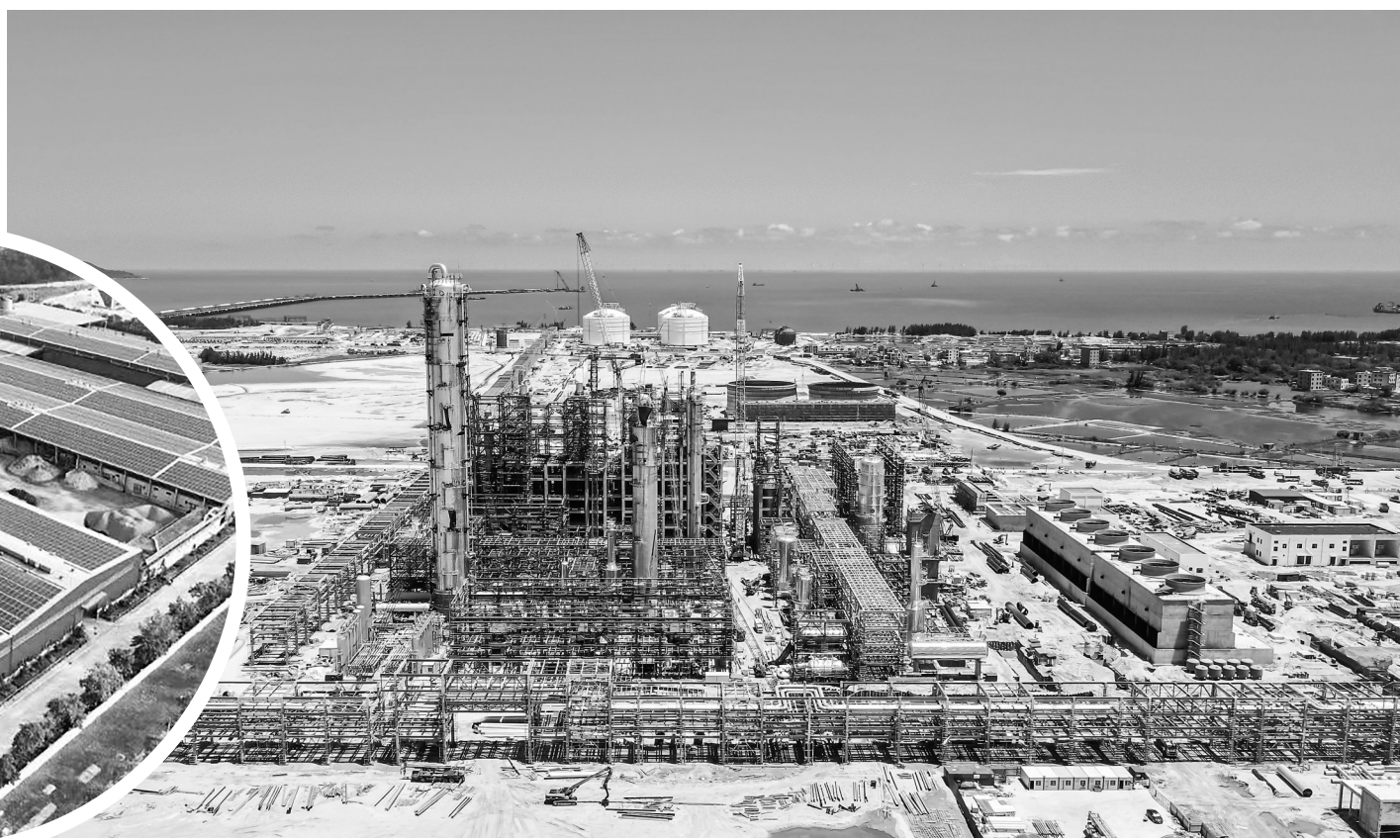
东华能源厂区。