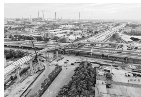
茂名大道快速化改造有序推进。