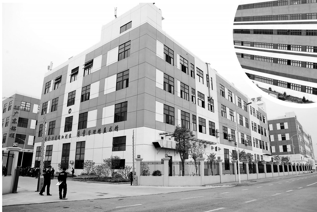
茂茂产业转移合作园蒲康工业园。