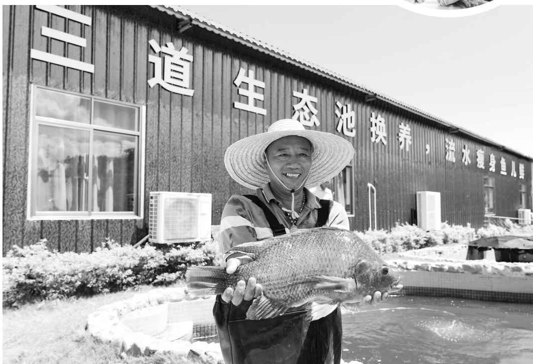
吊水罗非鱼。