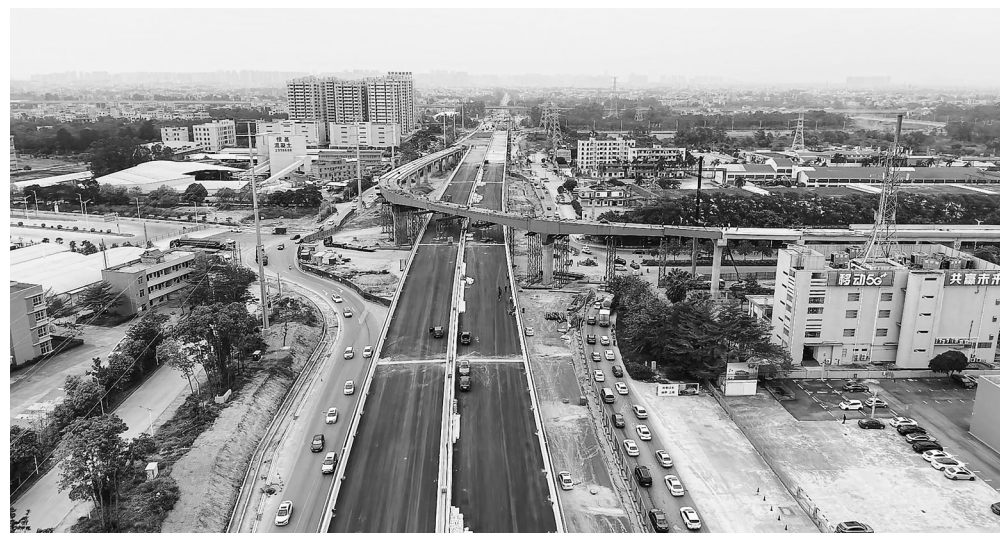
茂名大道快速化改造快马加鞭。

百越大道通车确保茂名南站运营;潘州大道茂名东货场支线新建工程顺利通过交工验收正式通车运行;官山六路实现通车;省道S280线改建工程(东环大道)(一期)跨铁路特大桥开工;云茂高速新增水口互通立交正式通车。