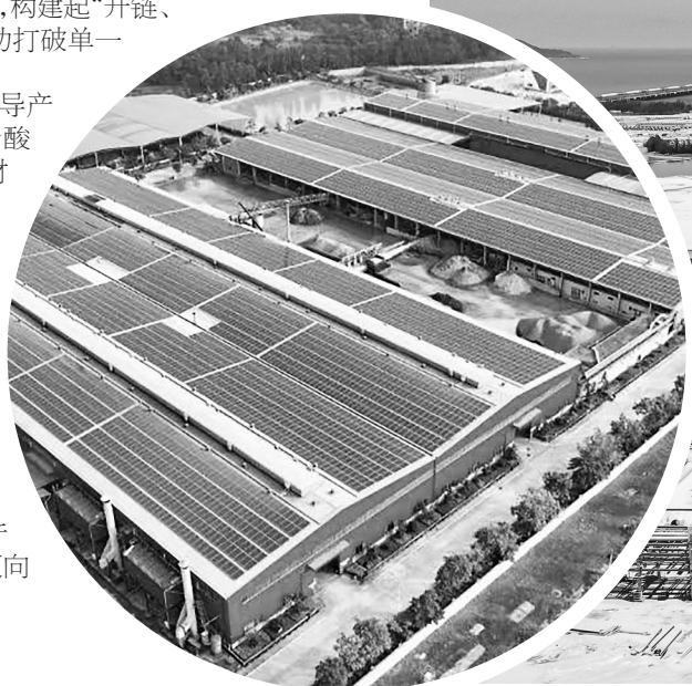
广东粤桥钛铝生产基地。

同时,推动低空经济与物流、农业、文旅跨界融合,开通19条低空航线。产业韧性与创新活力同步增强,为茂名迈向5000亿GDP目标奠定坚实基础。