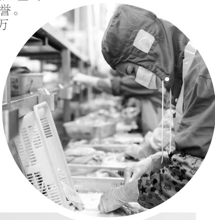
►罗非鱼产品加工线。