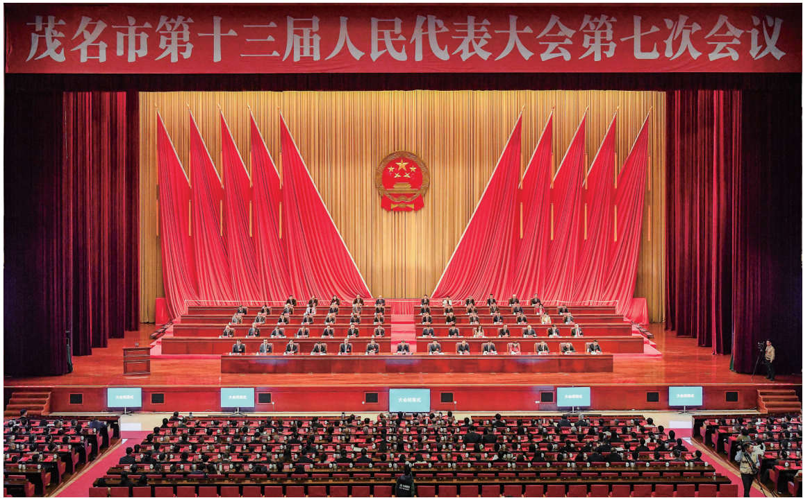
2月5日上午,茂名市第十三届人民代表大会第七次会议闭幕。