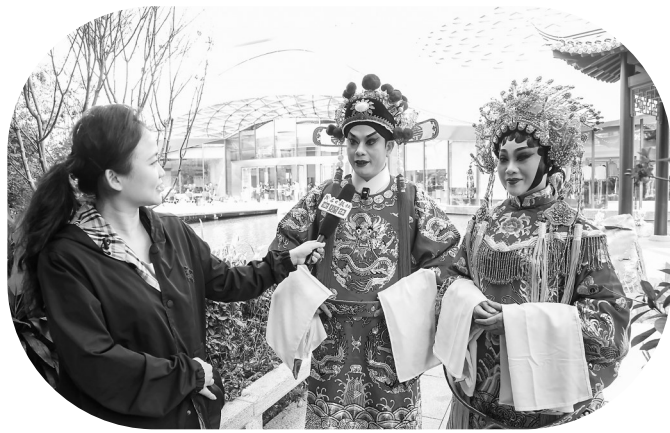
演员接受茂名日报社全媒体记者采访。