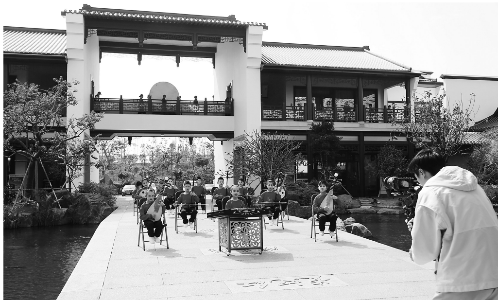
广东广播电视台在柏桥服务区录制“百人国乐迎新春”节目。

懈怠,这份对国乐的热爱和对表演的重视,让人十分动容。”信宜市水口镇第一中心小学老师甘婷看着眼前的小乐手们,眼中满是欣慰。她表示,这样展演不仅是一次展示,更是一次成长,让孩子们在练习中感受国乐之美,在协作中传承传统文化。