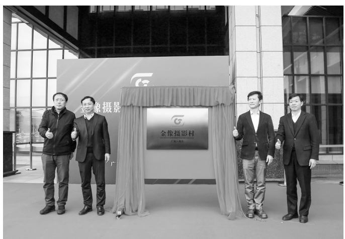
金像摄影村揭牌仪式现场。