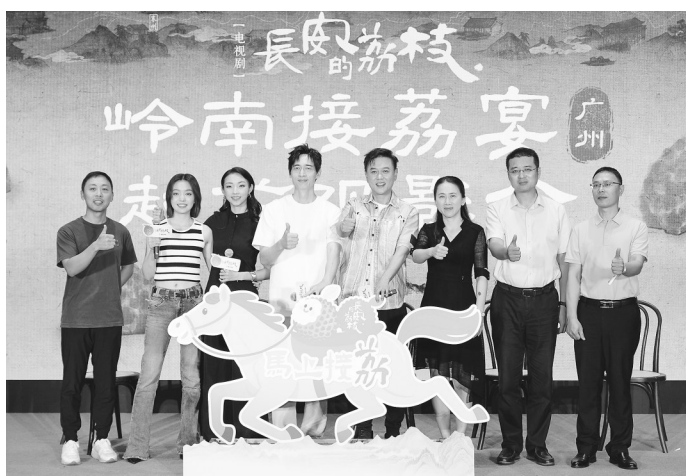
电视剧《长安的荔枝》广州观影会。

面向未来,报告提出实施文化惠民工程,加强全民阅读推广,开展“洪拳进校园”“文艺赋美乡村”等活动,擦亮“非遗半小时”“好心舞台百姓演”等品牌,推动优质文化资源下沉基层,让人民群众在家门口就能享受高品质的文化生活,真正实现文化为民、文化惠民。同时,还提出强化文艺精品创作,出台微短剧发展措施,提升和推广《冼太舞》《冼太军魂》,塑造年例文旅IP,激发全社会文化创新创造活力,推出更多彰显茂名特色、深受群众喜爱的文艺作品,以高质量文化供给增强人民的精神力量。