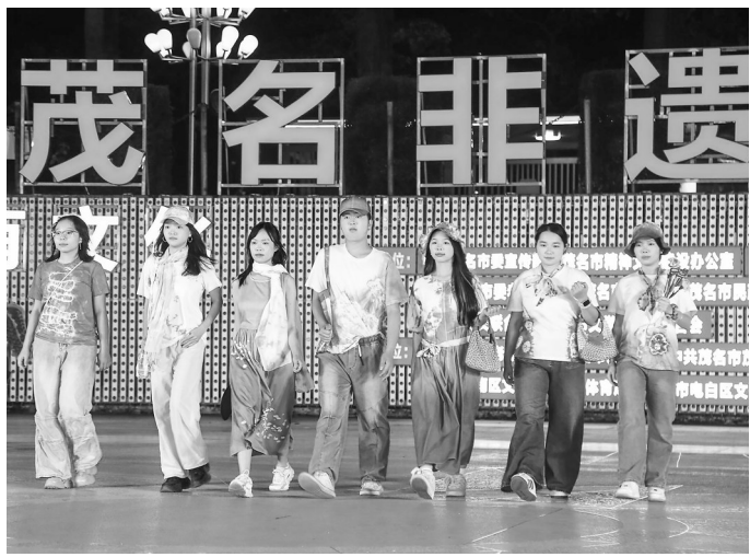
打造“非遗半小时”展演品牌,推动全市非遗项目从静态展示走向动态传承。

满足人民日益增长的精神文化需求,是文化建设的出发点和落脚点。过去五年,茂名文化服务体系建设和成效显著:油页岩炼油厂被认定为国家工业遗产,化橘红中药文化非遗工坊入选全国典型案例;冼夫人文化生态保护区入选省级名单;市新影剧院建成开放,信宜建成全省首个社会化管理图书馆,砺儒教育文化史馆基本建成等,文化设施日益完善,文化资源更加丰富。