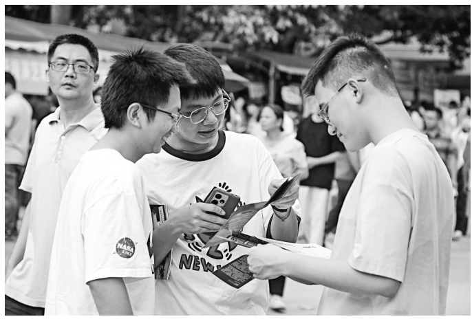
开发就业岗位,吸纳高校毕业生等青年到我市稳定就业。