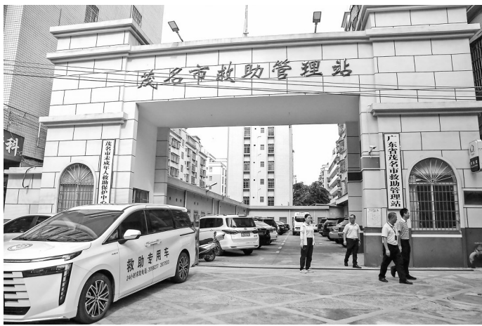
逐步缩小城乡社会救助差距。

切度最高的两大民生领域。报告对此提出一系列扩优提质、促进均衡的务实安排。 在教育领域,报告体现为“夯实基础”与“提升能级”双线并进,一方面,通过深化教育改革,强化AI赋能,增加优质学位供给,支持各地创建国家义务教育优质均衡发展县(市、区)等举措全力破解基础教育资源不均衡的难题,让每个孩子都能“上好学”。另一方面,支持广东石油化工学院“申博改大”、推动市属高职资源整合升本,则是从高等教育、职业技能教育层面发力,旨在为茂名产业转型升级和长远发展培养、吸引、留住更多高层次技术技能人才,将教育优势转化为发展优势。