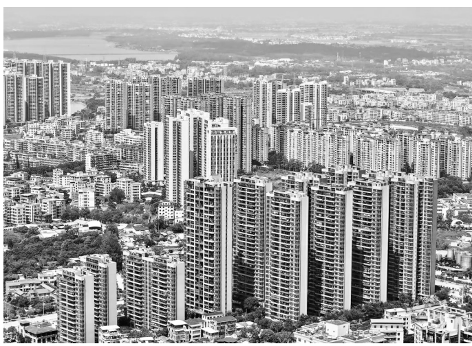
茂名城区。