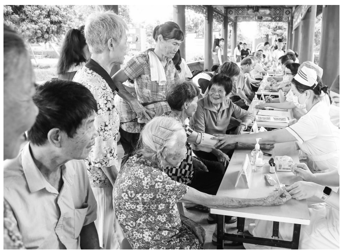
加强老年人健康管理。