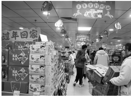
年货供应充足。