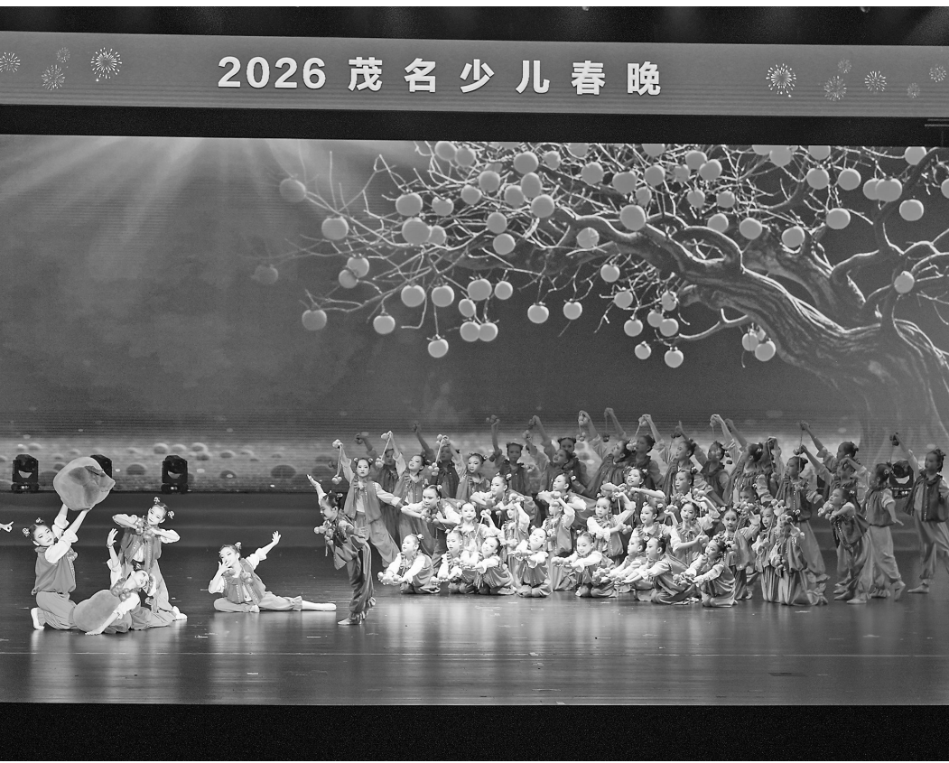
晚会现场。

“童心迎省运 欢歌贺新春”2026茂名少儿春节联欢晚会是我市重点培育的文化品牌,也是茂名市广播电视台践行主流媒体责任、深耕少儿美育实践的年度力作。主办方表示将继续为青少年搭建多元化艺术展示平台,助力少年儿童全面成长,为茂名文化繁荣发展注入新活力。