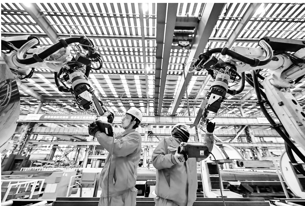
在天津市滨海新区,海上油气平台建设工人操作打磨机器人。