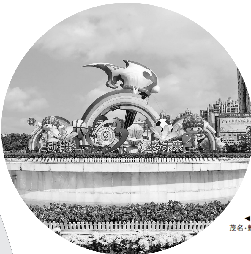
文化广场上的《好心茂名·魅力省运》景观

岁月在变,乡情不变。龙西的年例,暖的是人心,聚的是亲情,是龙西人心中最珍贵、最难忘的乡土记忆。