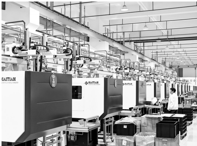
乐天高新科技产业园。

从永青大道勾勒城市“内环”骨架,到潘州大道北拓展城市发展边界,再到各大片区配套设施逐步完善,高州的城市框架不断拉大,城市能级持续提升,旧城焕新颜、新区展新姿,一幅山水相融、宜居宜业的城市发展新画卷正徐徐铺展。