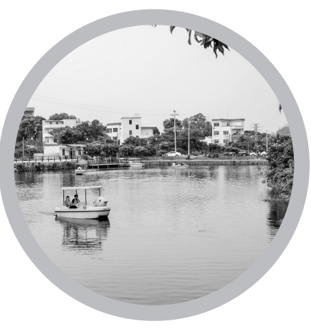
泗水镇大联滩底村舒适的亲水休闲场所。