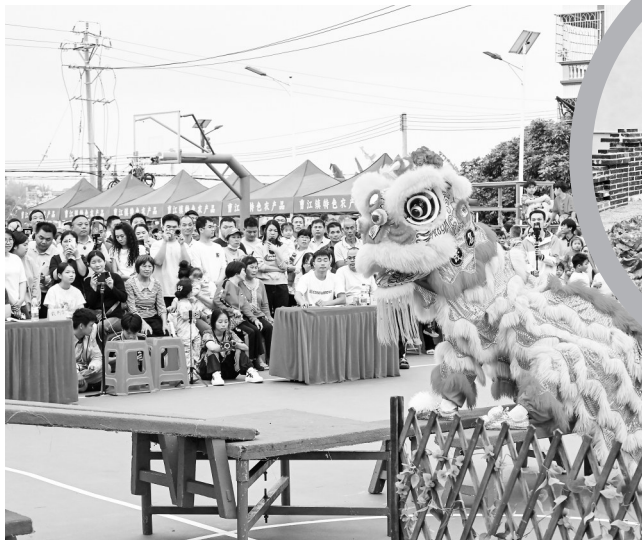
曹江镇创新“文化+市场”的运作模式。

“高州的发展实践证明,只要找准路径,真抓实干,‘百千万工程’就能落地生根、开花结果。”调研组在点评中指出,高州的经验值得全市学习借鉴。骏马踏春春色好,奋蹄扬鞭正当时。站在“十五五”开局之年的新起点上,高州正以更加昂扬的姿态,奋力书写城乡区域协调发展的精彩华章。