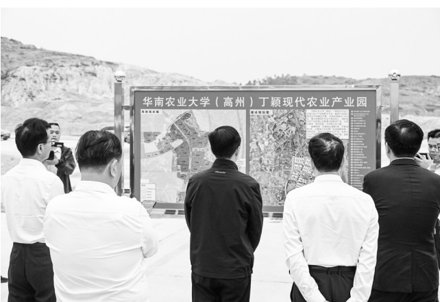
华南农业大学·高州丁颖现代农业产业园规划建设情况。