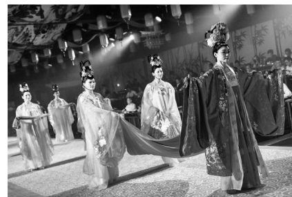
边看表演,边品高凉宴。