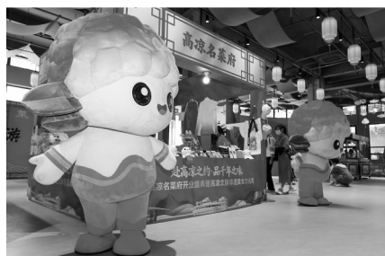
高凉名菜府开业现场。

作为活动的重头戏,嘉宾们品鉴了极具特色的“山海·高凉宴”,并欣赏了古风表演。一道道取材于粤西山海的佳肴,一个个饱含茂名人文历史故事的精彩表演,不仅让味蕾得到了享受,更让在场嘉宾深刻领悟了高凉菜“山海入味、不时不食”的饮食智慧和高凉文化的独特魅力。