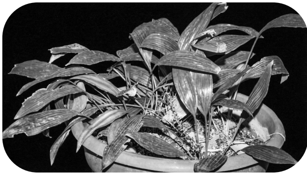
▲在云开山保护区采集到的处于盛花期的大雾岭球子草植株。