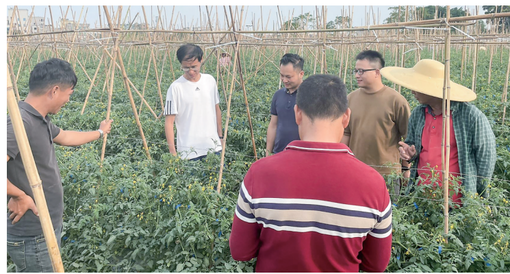
邀请省农科院专家到田间地头讲解种植技术。

群服务中心建设。通过这一系列“党建+”举措，组团单位从多维度赋能基层组织，让党旗在乡村振兴一线高高飘扬，铸就了引领发展的坚强战斗堡垒。 “我们将以党建为纽带，加强对接紧密沟通，找准产业发展方向，助力海进村培育特色产业、提升‘造血’能力，为乡村振兴提供持续动力。”珠海市发展和改革委员会党组成员、副局长高飞表示，要充分发挥基层党组织战斗堡垒作用，为推动海进村乡村振兴出谋划策，共同书写乡村全面振兴的新篇章。