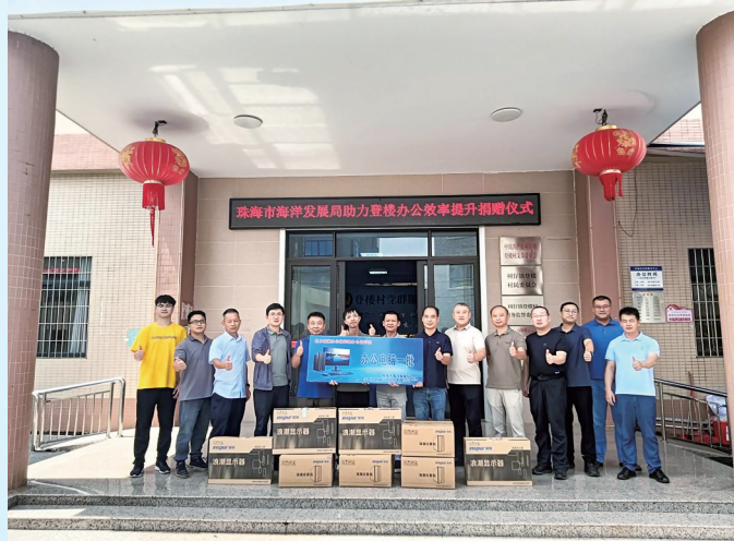
珠海市海洋发展局为登楼村捐赠办公电脑。