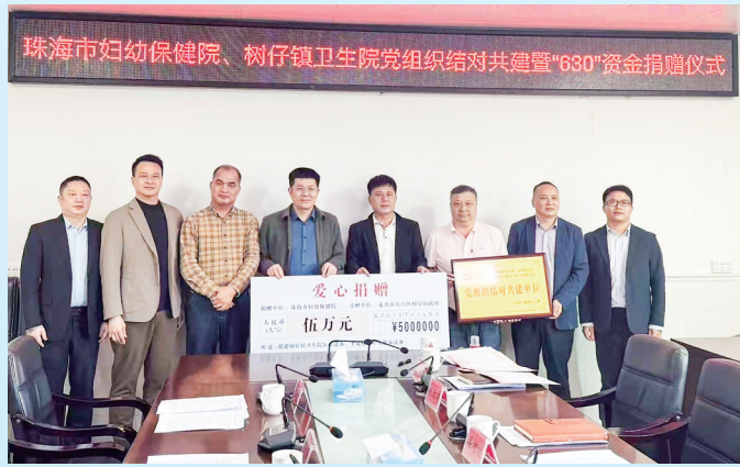
珠海市妇幼保健院、树仔镇党组织结对共建暨“630”资金捐赠仪式。