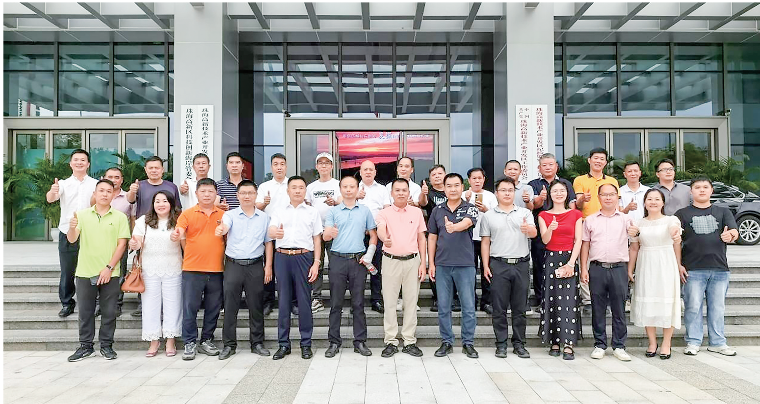
树仔镇班子及乡贤代表受邀赴珠海学习考察。