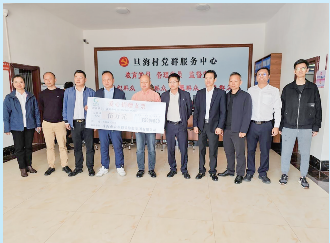
珠海市农业投资控股集团有限公司为旦海村捐赠乡村振兴基金。