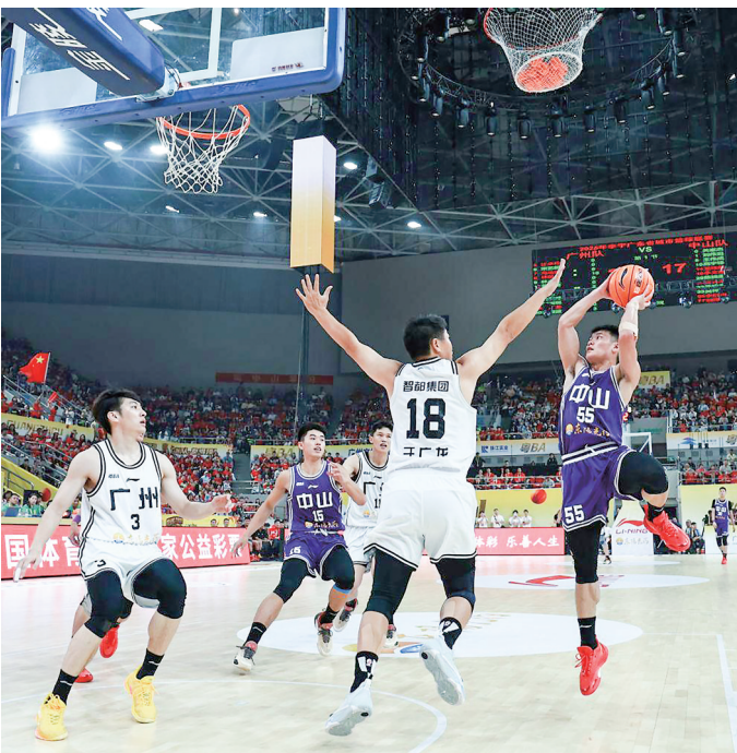
3月21日，广州队主场83:86不敌中山队。