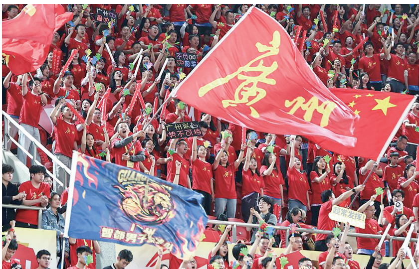
3月21日，2026年广东省城市篮球联赛在广州天河体育馆开赛。