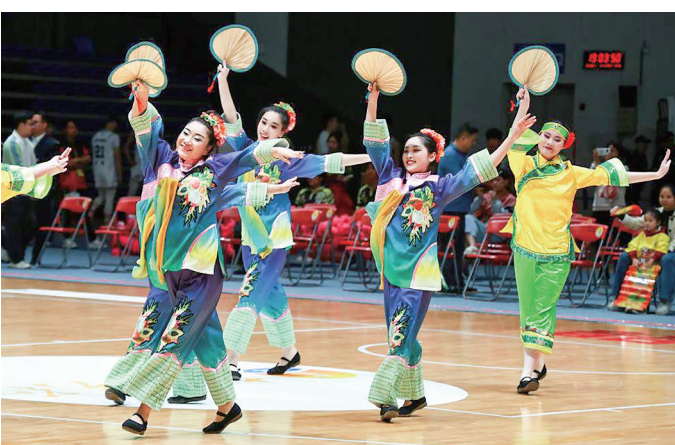
3月28日，在2026年广东省城市篮球联赛比赛中，韶关队主场73:65战胜梅州队。图为赛前进行的表演。

利用业余时间训练，为乐趣而战、为家乡而战。首轮大胜后，深圳队的一名球员被问到赛后会不会去吃宵夜，他的回答出人意料——“算了！明天还上班呢。”